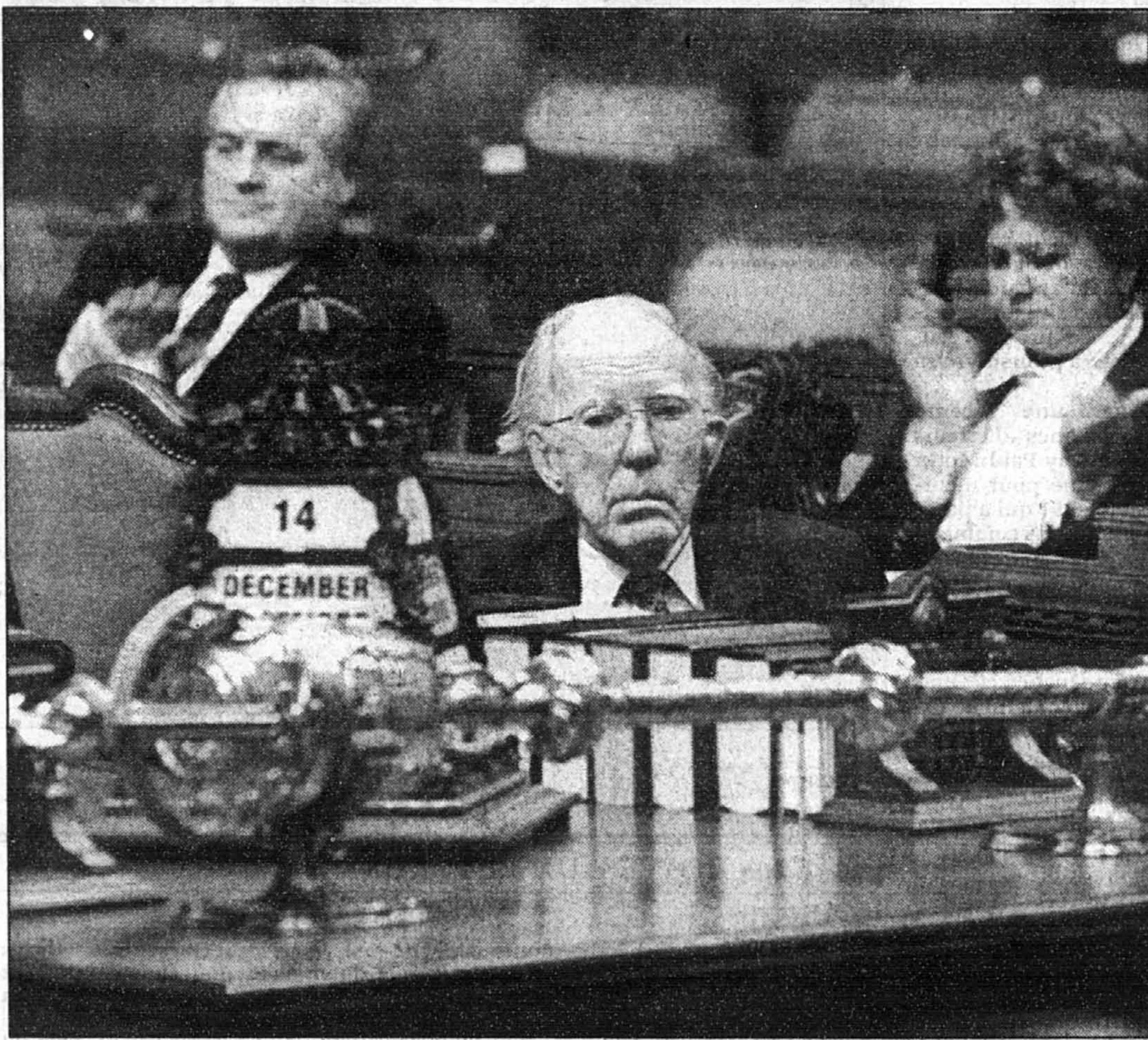
Depuis sa retraite de la vie publique, en 1984, Stanley Knowles avait sa place aux Communes, à la table du greffier de la Chambre.