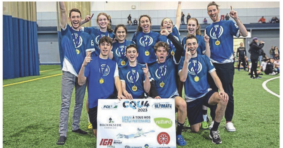
La formation Forges (16-18 ans) s'est méritée l'or après des matchs endiablés face aux Murmux de Montréal et au Quick de Québec.