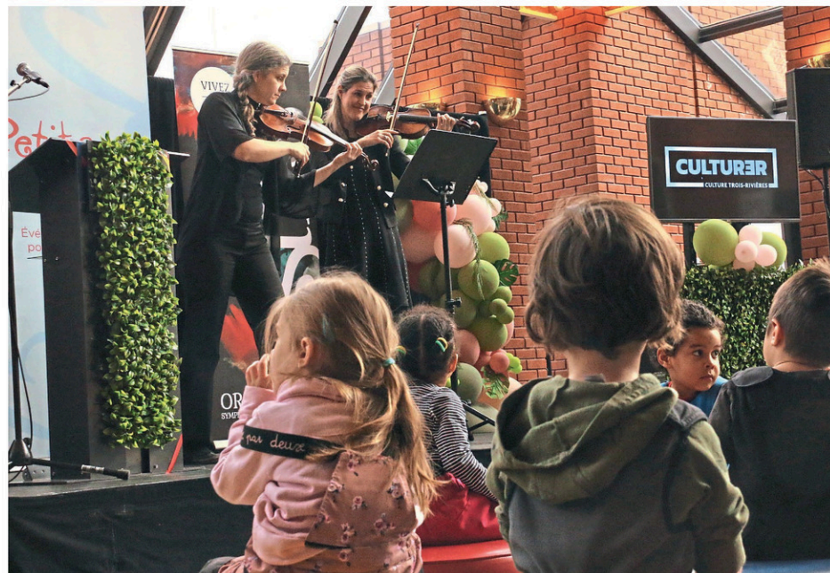
Des enfants du CPE Le Cheval Sautoir ont pu assister à une représentation du spectacle «Symphonie pour tout-petits!» de l'OSTR.

Cette dernière fait aussi valoir que l'offre québécoise de spectacles pour un jeune public a grandement augmenté dans les dix dernières années. «Il y a 10 ans, c'était beaucoup