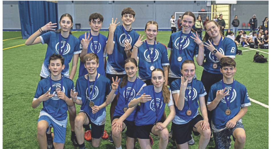
En ce qui concerne les plus jeunes (Forges 13-15 ans), ils ont également surpassé leur habituelle quatrième place en obtenant le bronze face à l'équipe de Québec.

Prenez note que le club trifluvien est toujours à la recherche de nouveaux joueurs désirant pratiquer l'Ultimate frisbee. Le club compte déjà sur des joueurs de Sainte-Geneviève-de-Batiscan et de Maskinongé, alors il n'est pas nécessaire d'être Trifluvien. Pour plus de détails, visitez le https://ultimate3rivieres.org