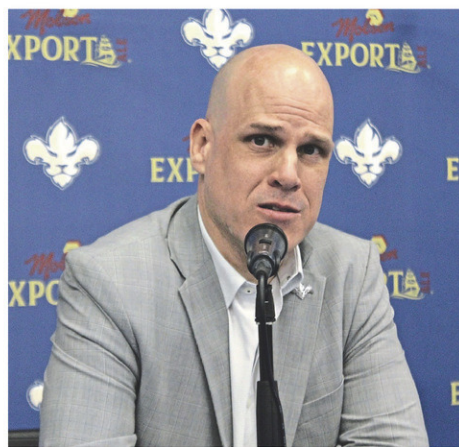
Le nouveau président et chef de la direction des Alouettes va terminer sa saison avec les Lions avant de plier bagage.

« Si j'avais eu la même offre il y a deux mois, ma réponse aurait été un non catégorique. Maintenant, avec l'achat par monsieur Péladeau, un passionné qui voit le succès à long