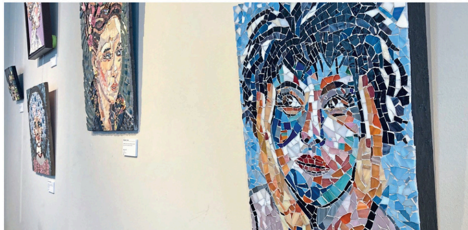
Une vingtaine d'œuvres sont exposées dans l'exposition « Mosaïque picassiette ».

L'exposition Mosaïque picassiette est présentée à l'Espace-Galerie EMA (802, rue des Ursulines) jusqu'au 28 mai.