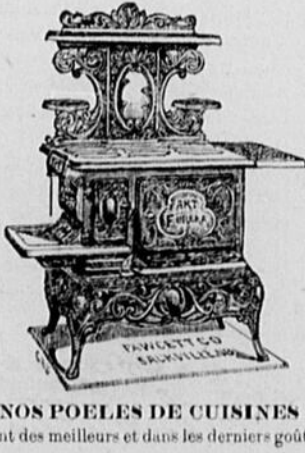
NOUS POELES DE CUISINES sont des meilleurs et dans les derniers goûts