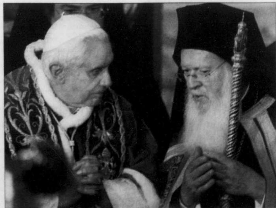
Accompagné de Bartholomée I er , Benoît XVI s'est rendu au Phanar, siège du patriarcat orthodoxe.