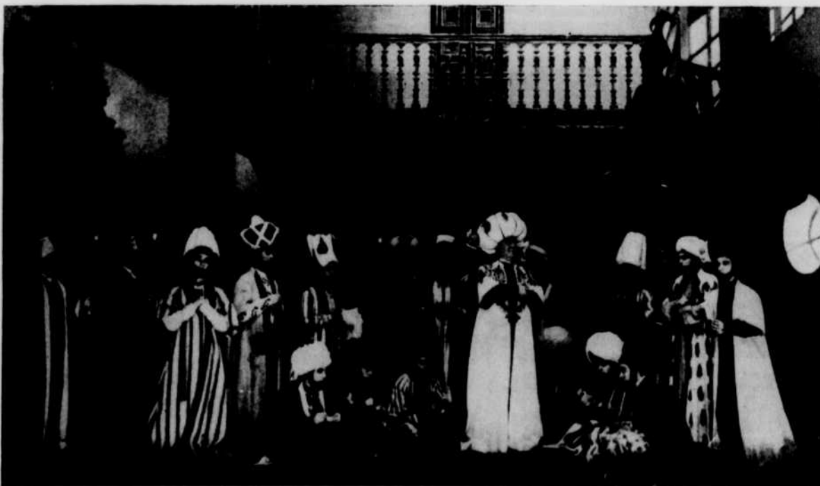
Une scène du "Bourgeois Gentilhomme" de Molière

Les beaux spectacles présentés à Montréal par la Comédie-Française, l'automne dernier, ont été enregistrés grâce au Service International de Radio-Canada que dirige Roy Royal.