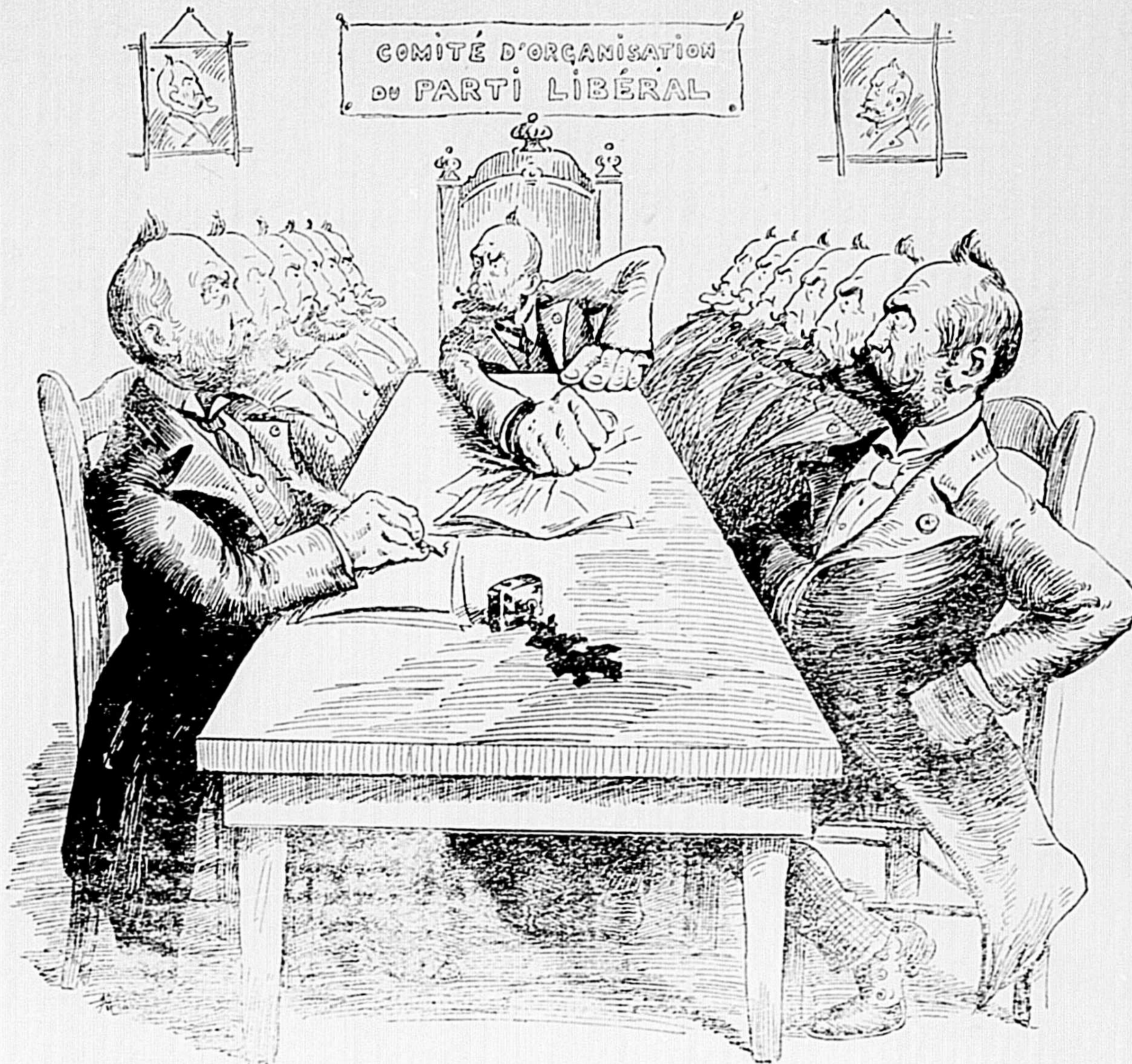
Une séance plénière au Comité libéral à Montréal.—Le sénateur Dandurand est présent