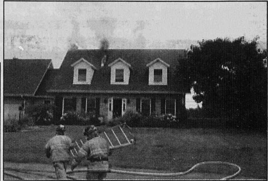
Pour circonscrire les flammes qui sortaient de la toiture de la résidence, au 8 Parc du golf, hier à Victoriaville, les sapeurs ont dû effectuer un trou béant afin de s'attaquer directement à l'élément destructeur.

Le véhicule est d'une valeur de 38 000 $ et à l'intérieur, il y avait pour 7 000 $ d'effets personnels: vêtements, chèques de voyage, caméras, etc.