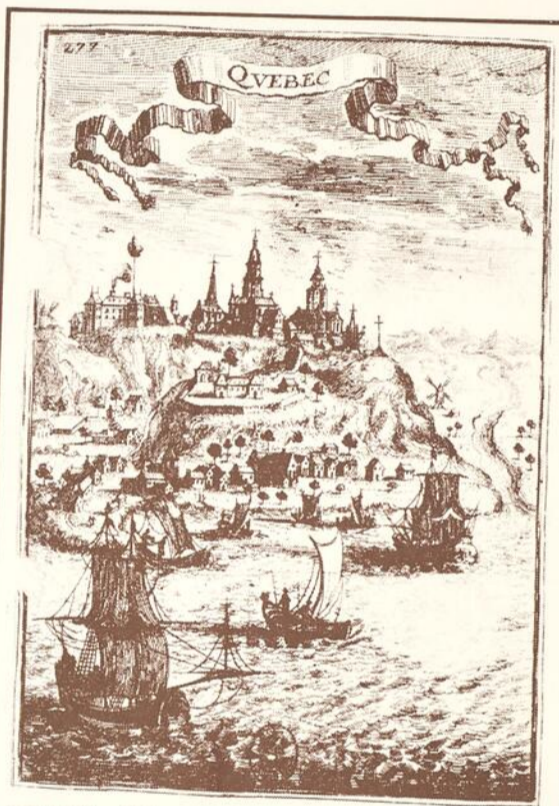
Bibliothèque Nationale du Québec