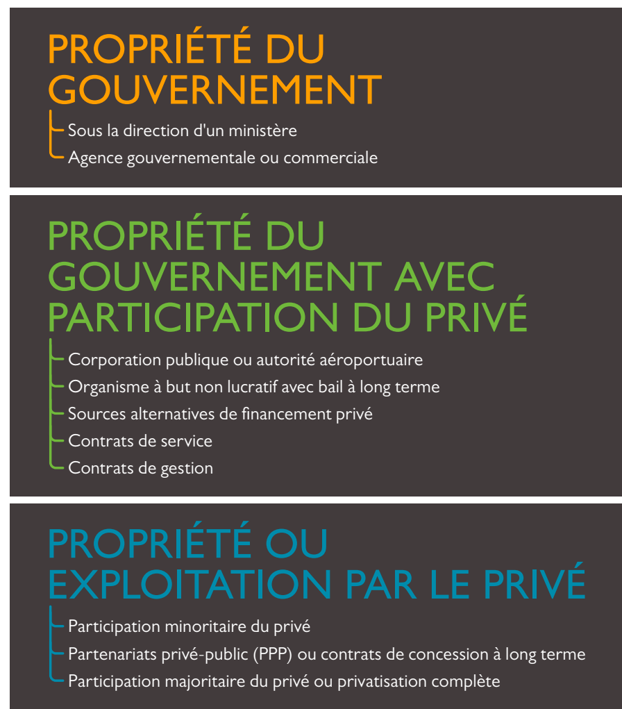
FIGURE 1 PRINCIPAUX TYPES DE MODÈLES DE GOUVERNANCE DES AÉROPORTS À TRAVERS LE MONDE