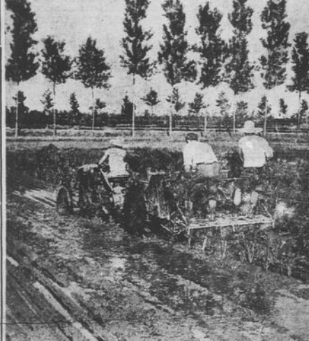
La produzione annua di riso si aggira intorno agli otto milioni di quintali, dei quali circa tre milioni sono assorbiti dai mercati esteri. Nella foto: operazione di trapianto eseguita da trainatrice meccanica.