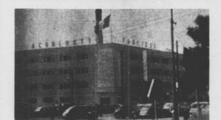
ACQUEDOTTO PUGLIESE — Nei pressi del lungo mare e del porto sorge la nuova ed importante sede dell'Acquedotto Pugliese.