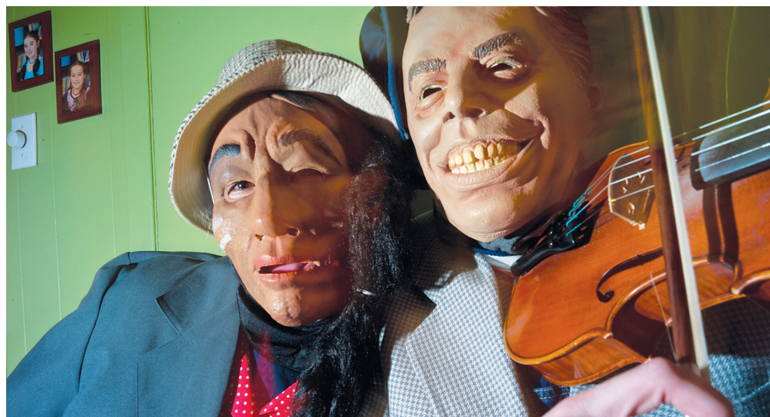
Les déguisements de la Mi-Carême sont de tous les genres. Le masque de caoutchouc domine, alors que les masques traditionnels apparaissent désormais vraiment plus rares.