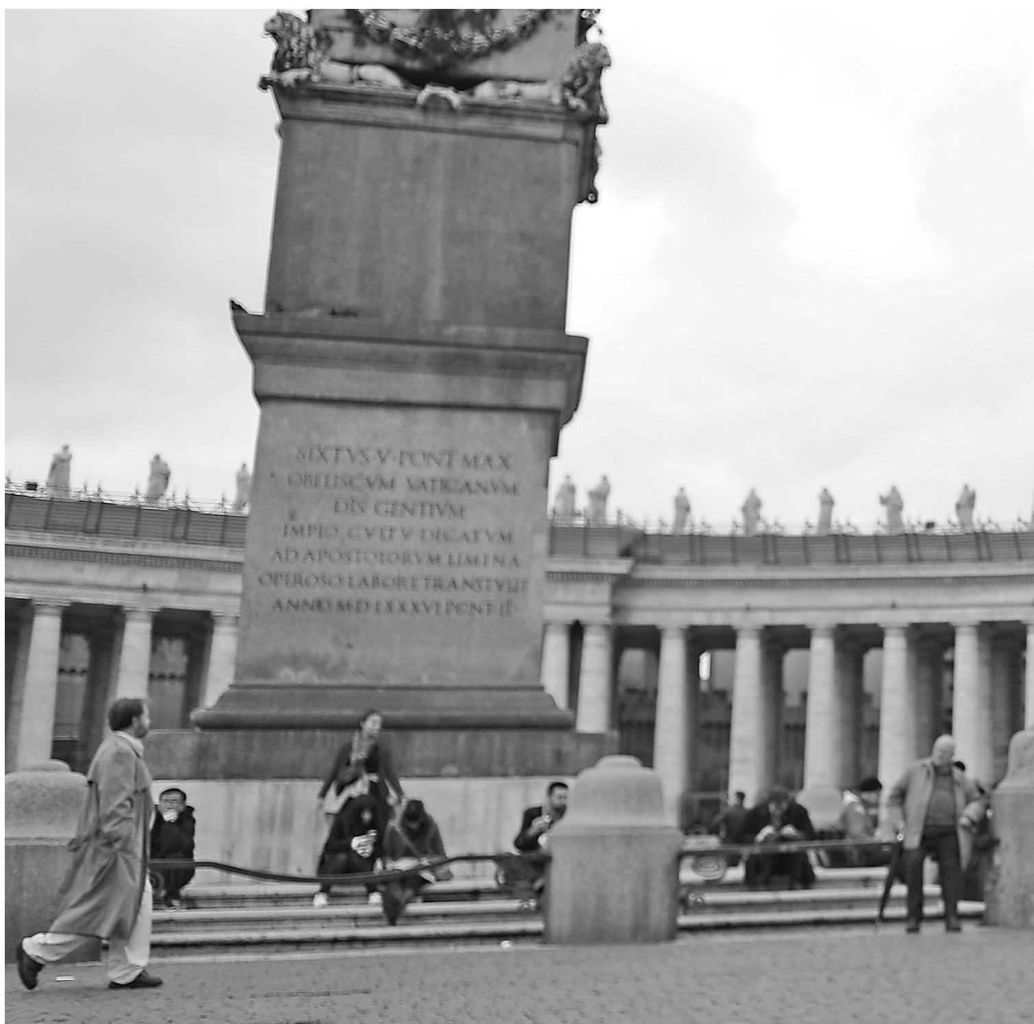
Le cardinal Marc Ouellet salue les journalistes en traversant la place Saint-Pierre de Rome pour se rendre à une rencontre préconclave.