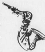
FESTIVAL DE JAZZ DE MONTREAL

Au 926, East McLemore, cœur du ghetto noir de Memphis, Tennessee, seule une plaque souillée rappelle que le studio des disques Stax s'élevait là, dans l'ancien théâtre Capitol. Le néon de la marquise, le fameux Stack O' Records, sert aujourd'hui de fond de scène au Rum Boogie Café, piège à touristes de Beale Street. Est-ce bien là, dans ce terrain vague, que Sam & Dave enregistrèrent Hold On, I'm Comin' en 1966? Est-il vrai qu'un peu plus tôt ce jour-là, David Porter hurla