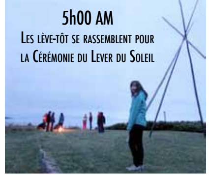
5h00 AM LES LÈVE-TÔT SE RASSEMBLENT POUR LA CÉRÉMONIE DU LEVER DU SOLEIL