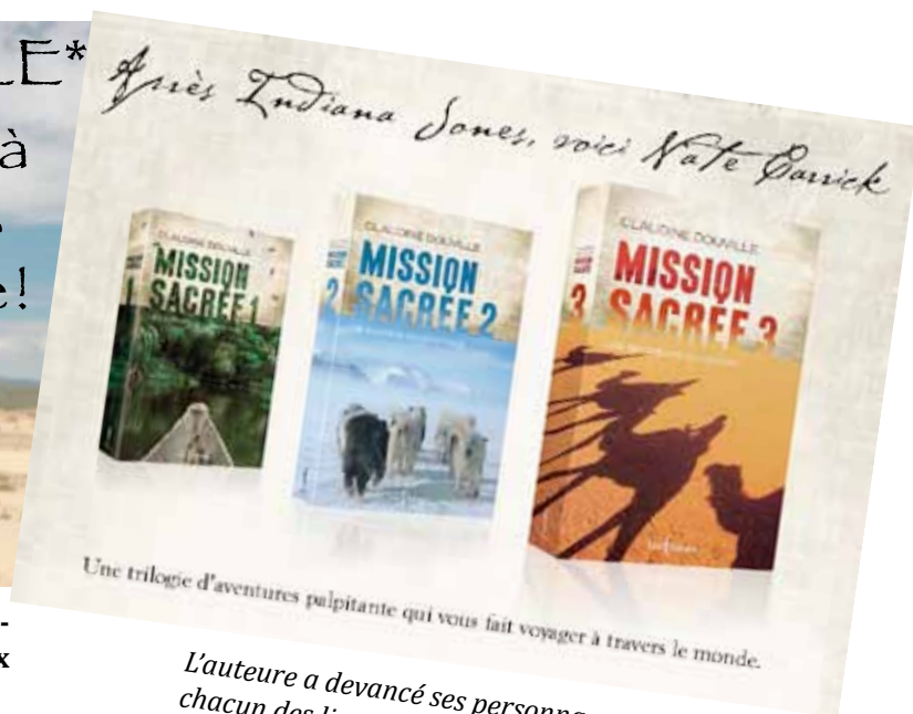
Après Indiana Jones, voici Nate Carrick Une trilogie d'aventures palpitante qui vous fait voyager à travers le monde.