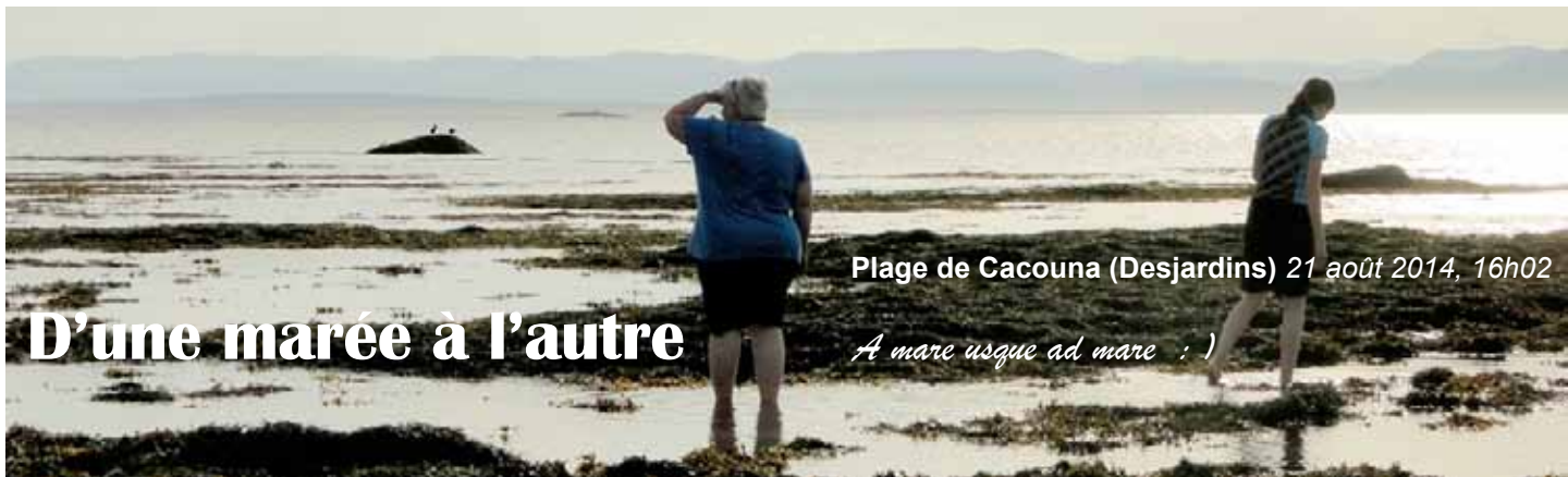
Plage de Cacouna (Desjardins) 21 août 2014, 16h02