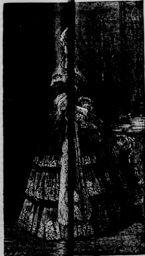
MARIE-AMÉLIE, FEMME DE LOUIS-PHILIPPE