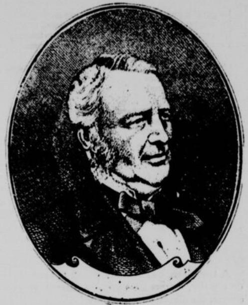
L'HON. R. E. CARON

Le second lieutenant-gouverneur de Québec, l'honorable René Edouard Caron, est né l'an 1800, à Sainte-Anne de Beauport. Admis au barreau en 1826, il était échevin de Québec en 1823, maire et député en 1834. Après l'union des Canadas (1841), M. Caron siège au Conseil législatif jusqu'en 1853, époque à laquelle il fut nommé juge de la Cour Supérieure. Deux ans après, il devint juge de la Cour d'Appel.