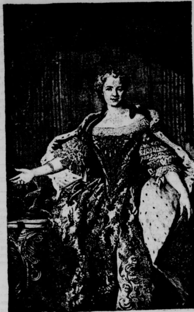
MARIE LECZINSKA, FEMME DE LOUIS XV