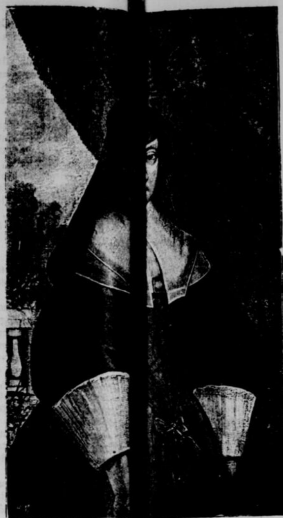
ANNE D'AUTRICHE, FEMME DE LOUIS XIII