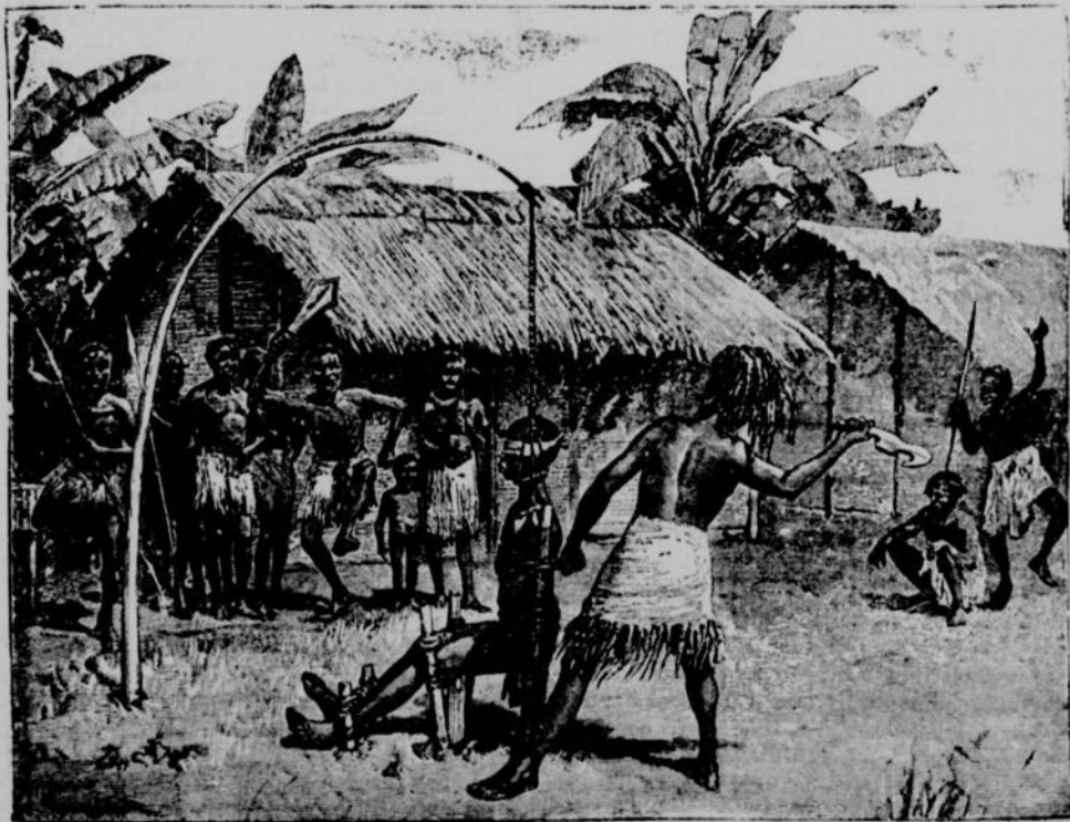
D'un seul coup, l'exécuteur sépare la tête du corps.—Page, 529, col. 2.