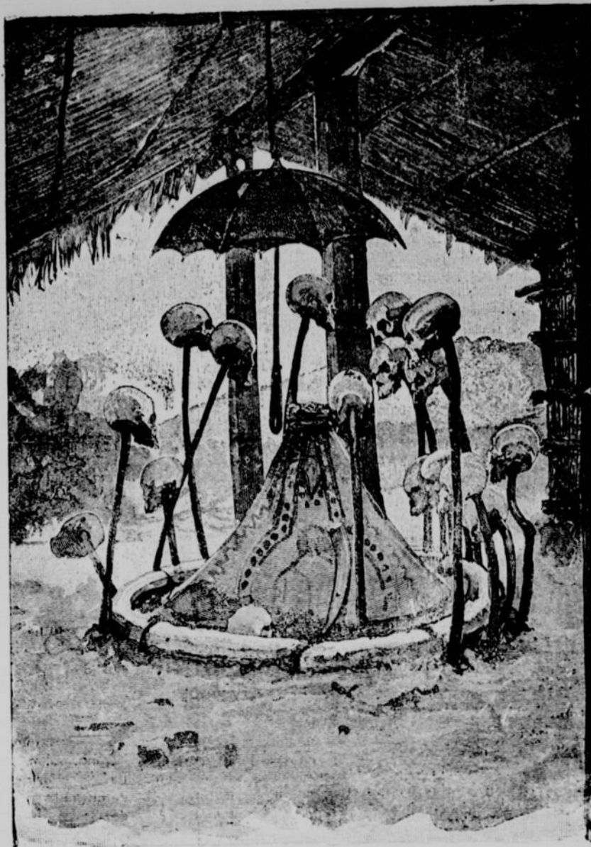
Les crânes décorent le monument.—Page 528, col. 3

Le voyageur italien raconte avoir vu plus d'une fois les parents d'un nègre à l'agonie "lui tirer le nez et les oreilles de toutes leurs forces, lui donner des coups de poing sur le visage, lui agiter les bras et les jambes avec violence et lui fermer la bouche pour l'étouffer plus promptement; d'autres le prenaient par les pieds et par la tête et le laissaient tomber après l'avoir élevé le plus haut possible; d'autres, se mettant à genoux sur sa poitrine, la foulaient de manière à