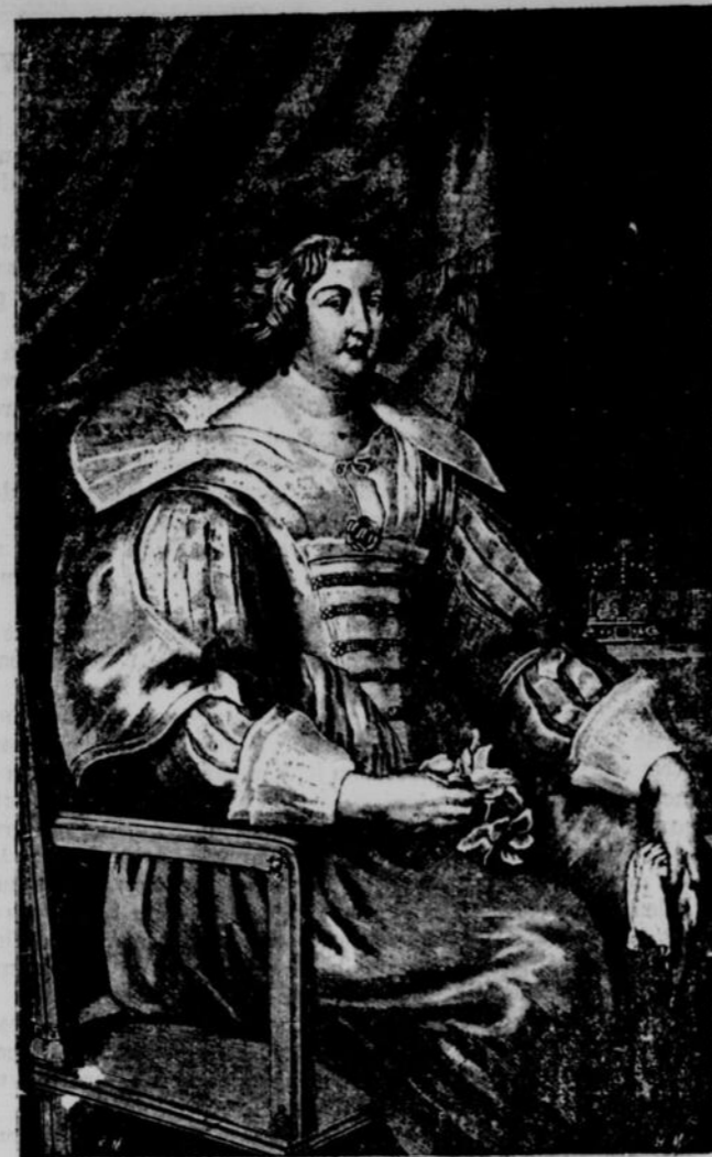
MARIE DE MÉDICIS, FEMME DE HENRI IV