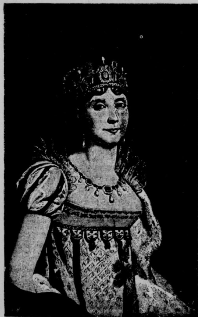
JOSÉPHINE DE LA PAGERIE, 1 RE FEMME DE NAPOLEON I ER