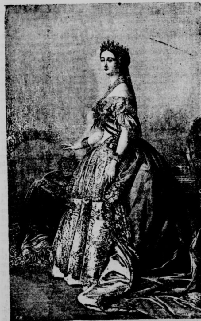
EUGÉNIE, FEMME DE NAPOLEON III