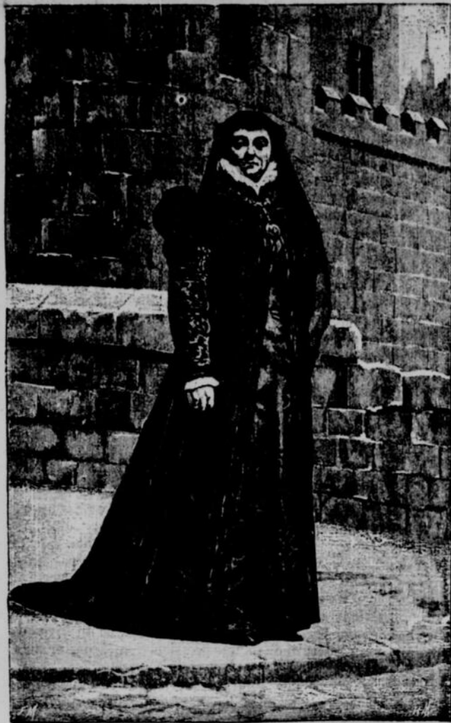
CATHERINE DE MÉDICIS, FEMME DE HENRI II