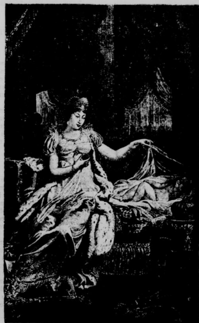
MARIE-LOUISE, 2 ME FEMME DE NAPOLEON I ER