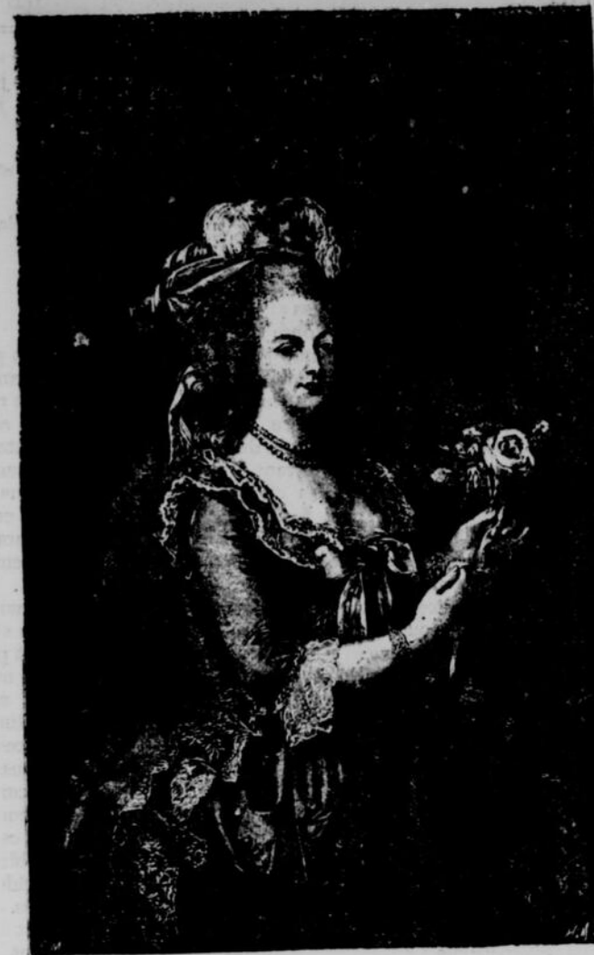
MARIE-ANTOINETTE, FEMME DE LOUIS XVI