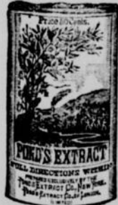
Fac-Simile du Flacon en- veloppé de papier chamois.

Demandez le Pond's Ex- tract. Evitez les imitations