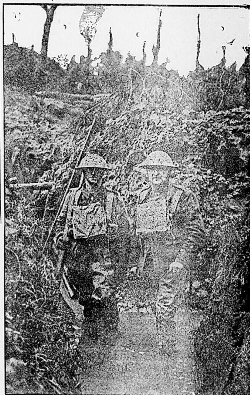
Vue d'une tranchée inondée