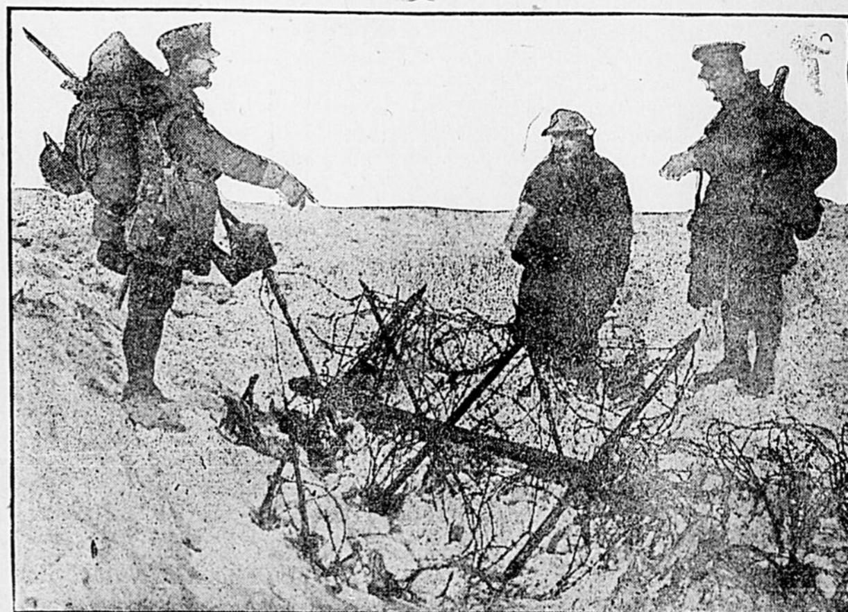
Sur le front ouest—Ces soldats reconnaissent une partie des fils barbelés qu'il leur fallut traverser près d'Ouvillers, au commencement de la bataille de la Somme.