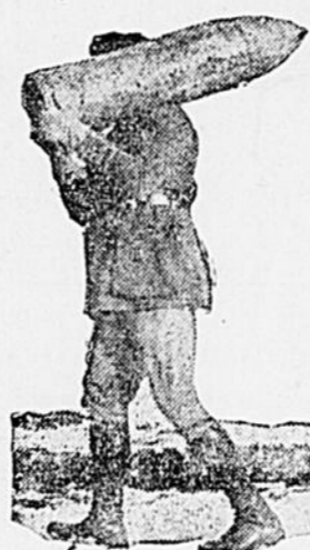
Officier canadien portant sur son épaule un obus allemand de 200 lbs.