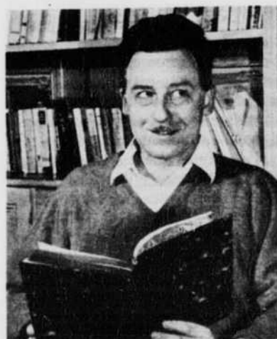
Michel de SAINT-PIERRE