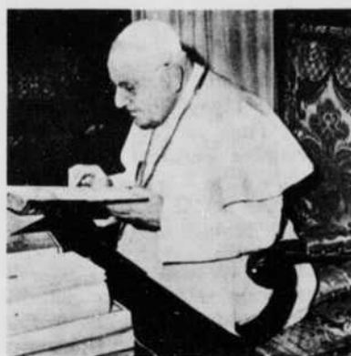
S. S. JEAN XXIII