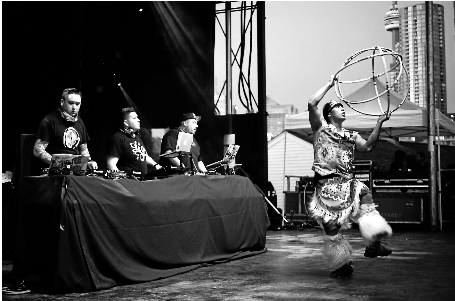
La formation amérindienne est composée de NDN, Bear Witness et DJ Shub.

La formation, composée de NDN, Bear Witness et