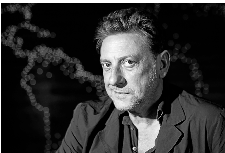
Sergio Castellitto, président du jury du FFM.

Les grands cinéastes italiens comme Vittorio De Sica, Rossellini, Fellini, Ettore Scola, Mario Monicelli, etc. Mais j'ai aussi eu la chance de travailler avec des gens de ma génération comme Tornatore et avec