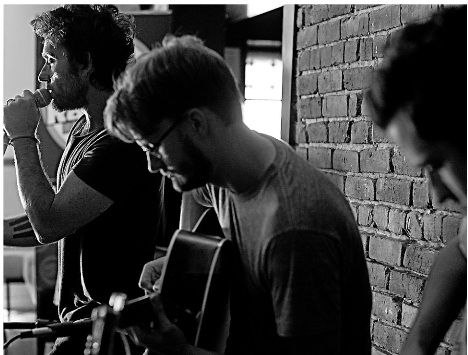
Le groupe Le Trouble en répétition au Pub quartier latin.