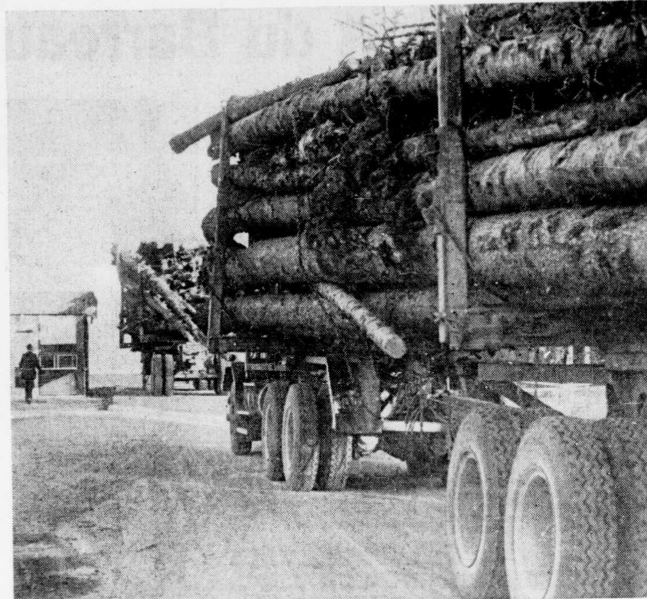
Des acheteurs étrangers ont acheminé du bois de pulpe vers les Etats-Unis.