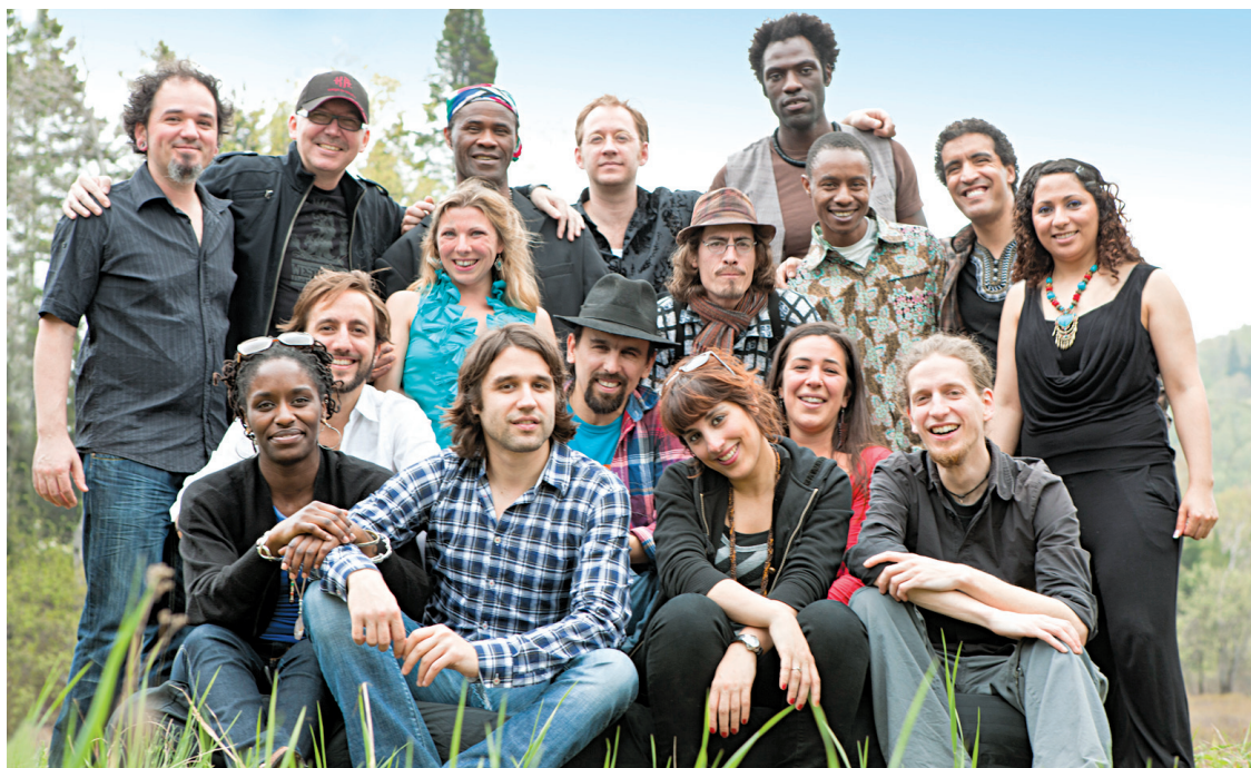
Les dix-sept musiciens qui ont donné vie à Arometis .

Tous ces artistes, qui mènent une carrière professionnelle à l'extérieur, viennent s'insérer aux pièces des autres dans Arometis . «Il est bien certain que les 17 artistes ne se retrouvent pas