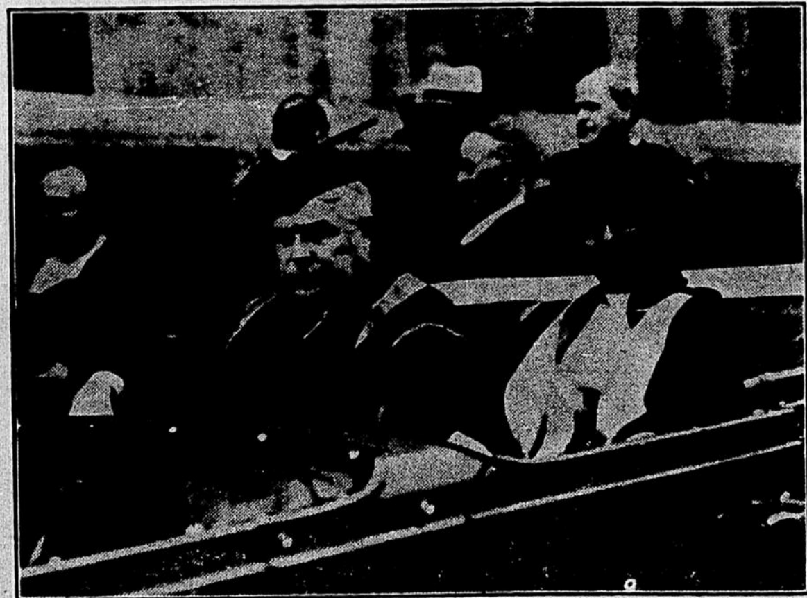
Son Eminence le Cardinal Villeneuve au McGill

Judi matin, le 25 mai, avait lieu à l'Université McGill de Montréal, la cérémonie annuelle de la collation des diplômes, à laquelle assistaient plusieurs personnalités canadiennes. Cette année, la cérémonie présentait un intérêt tout spécial pour les Canadiens-français à cause de la présence de son Eminence le Cardinal Jean-Marie Rodrigue Villeneuve, que la grande université de langue anglaise voulait honorer en lui conférant le titre de docteur en droit. Nous voyons ici son Eminence se rendant à l'Université en compagnie de M. E. W. Beatty, président du Pacifique Canadien et aussi Chancelier du McGill.