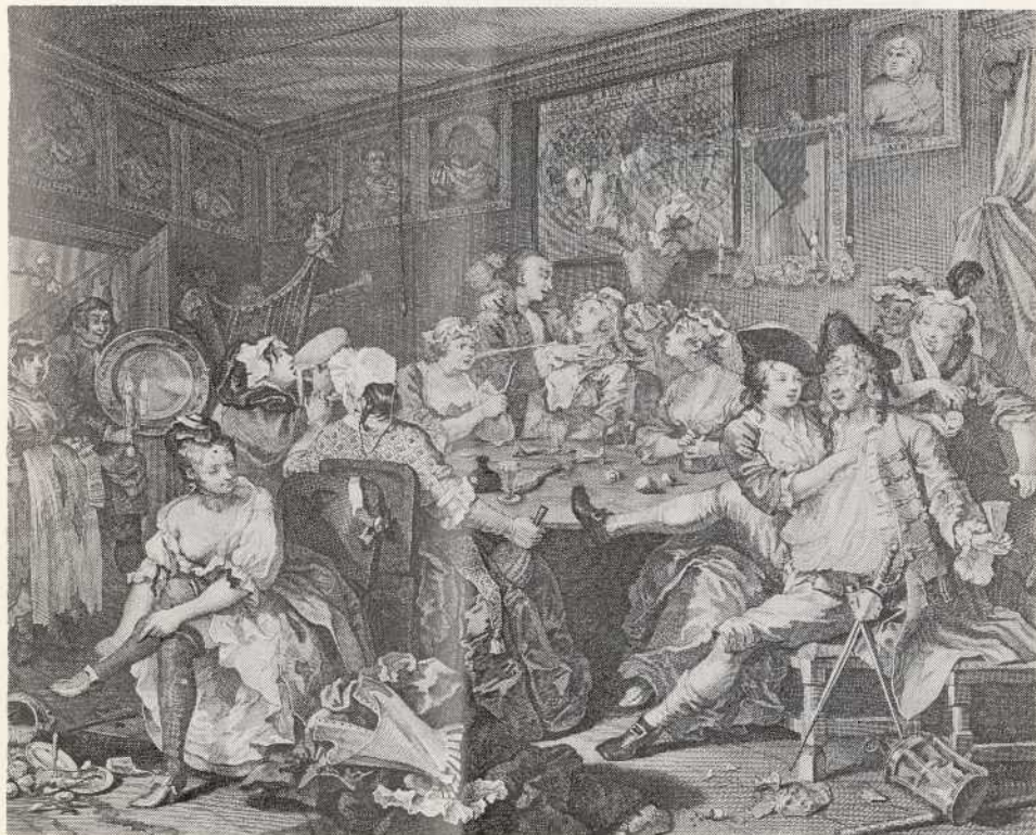
La maison close de Mother Goose / Mother Goose's Brothel

Les principaux acteurs tirent la morale de la fable : l'oisiveté est la mère de tous les vices.