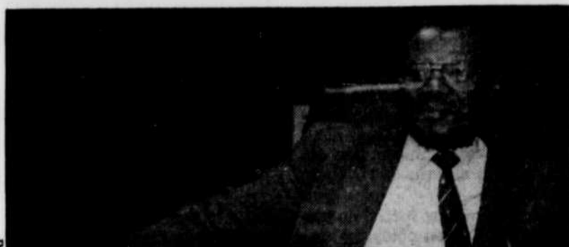
Le chef zoulou Buthelezi risque de perdre tout pouvoir après la disparition des bantoustans en Afrique du Sud.

À diverses reprises, M. Mandela a affirmé qu'il était prêt à tous les compromis sauf sur deux points : la date des élections et l'unicité de l'Afrique du Sud.