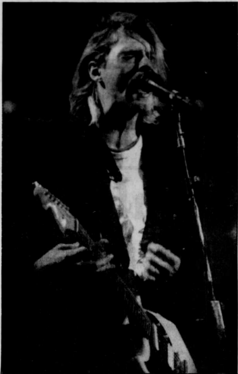
Issu d'un foyer brisé, Kurt Cobain avait canalisé ses frustrations dans un rock dérivé du punk qui a eu un impact mondial sur les jeunes avec des chansons comme « Smells Like A Teen Spirit » et « Lithium ».

À travers Nirvana, Seattle devint à la fin des années 80 et au