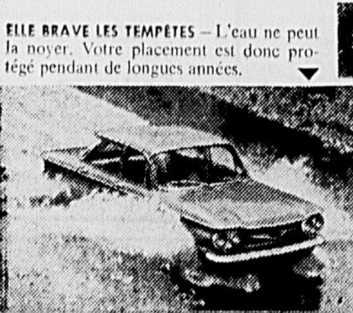
ELLE BRAVE LES TEMPÊTES— L'eau ne peut la noyer. Votre placement est donc protégé pendant de longues années.