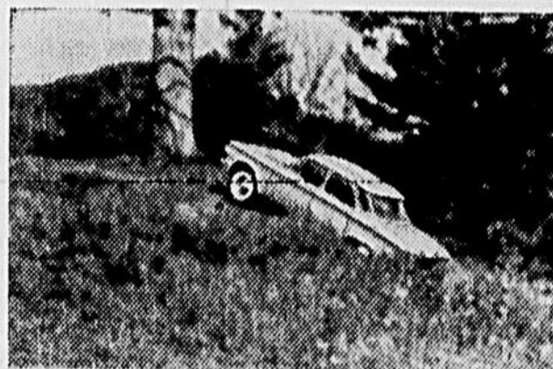
ELLE GRIMPE AVEC AISANCE— Avec le 6-cylindres Turbo-Air monté à l'arrière, vous pouvez grimper partout.