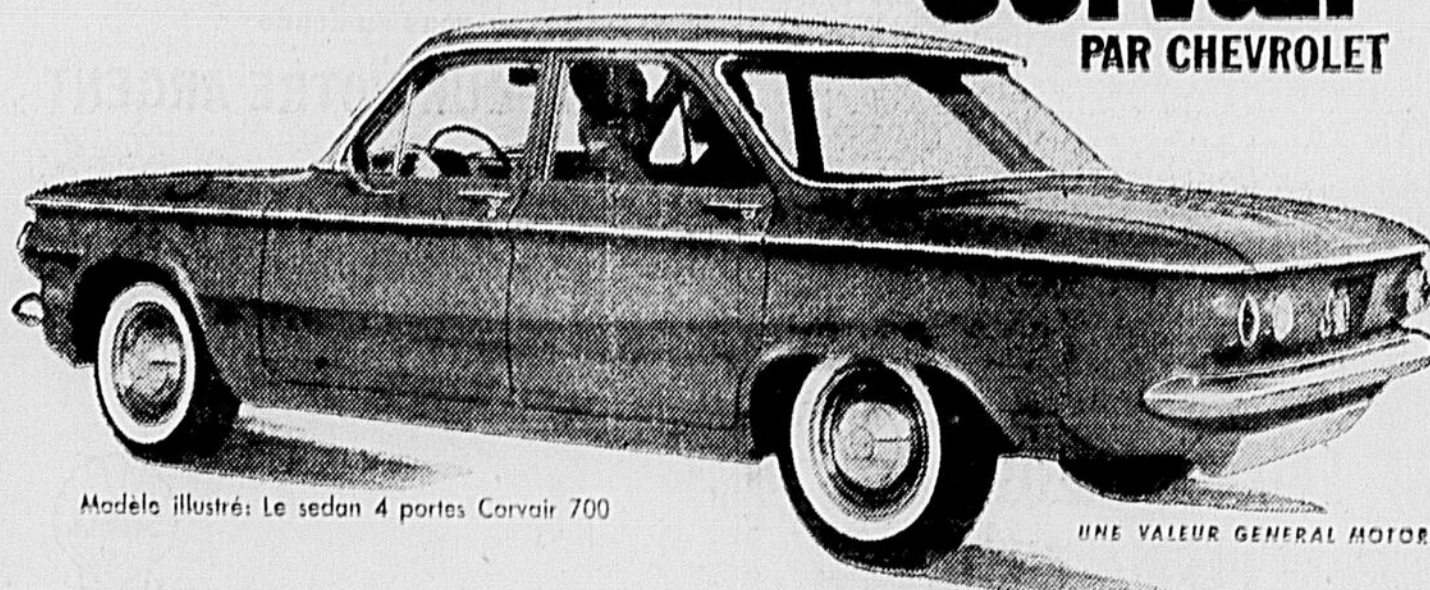
Modèle illustré: Le sedan 4 portes Corvair 700