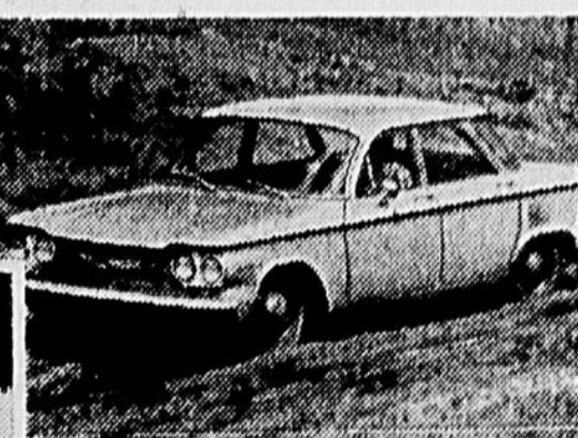
ELLE RESTE TOUJOURS DE NIVEAU— La Corvair a une suspension incroyablement souple. C'est la suspension Quadri-flex indépendante aux quatre roues.