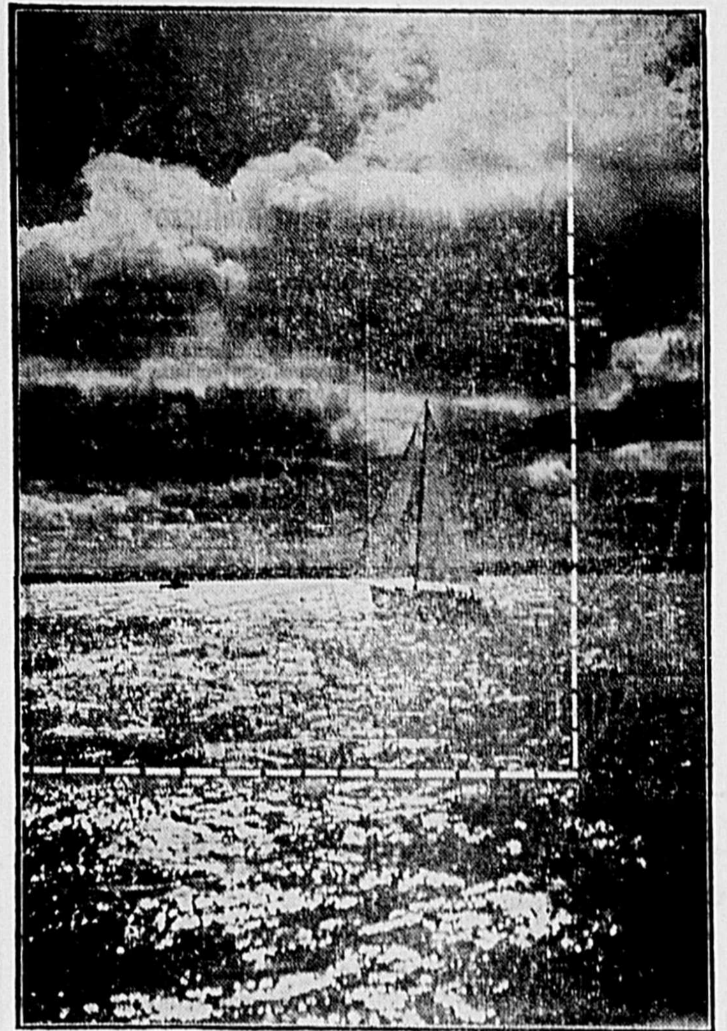
En découpant cot instantané le long de la ligne pointillée, et en l'agrandissant, on mettrait en relief le vif du sujet.

SCIEMENT ou non, nous gaspillons de l'espace dans la plupart de nos photos. Il peut y avoir à cela plusieurs raisons. Peut-être ce défaut dépend-il de ce que nous n'avons pas placé l'appareil dans une position où il pouvait isoler précisément la portion du sujet que captait notre oeil. Peut-être la lentille, même en bonne position, a-t-elle couvert plus de terrain que nous ne pensions. Peut-être notre concept de la photo a-t-il changé, une fois le délicé pressé.