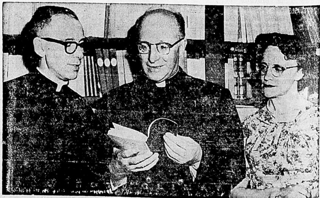
Les Editions Fides viennent de publier La Presse et les lectures, un ouvrage qui contient tous les enseignements et les directives de S.S. Pie XII sur ce sujet.

traverser sans qu'il ne lui arrive d'accident. Mais si ce même piéton ne prend aucune précaution et s'engage sur la chaussée sans regarder ni à gauche ni à droite, qui peut-il blâmer s'il est frappé par un automobile, demande le Comité provincial de Sécurité (Prudentia). Enseignez aux enfants à regarder à gauche et à droite avant de traverser une rue.