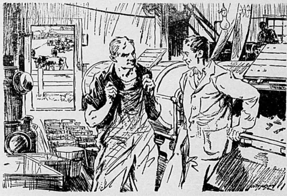
LES CANADIENS ET LEURS INDUSTRIES—ET LEUR BANQUE L'INDUSTRIE LAITIÈRE