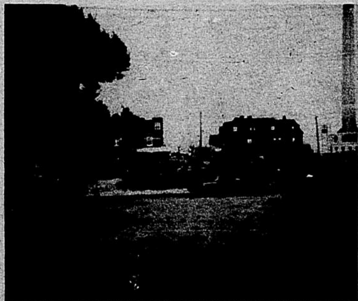
Philadelphie, ville en expansion dans les zones de taudis.