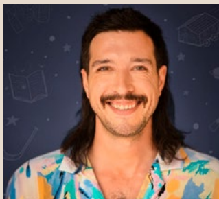
30 mai - 28 $ PB RIVARD