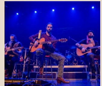
15 mai - 44 $ GUITAR STORY