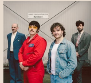
10 mai - 38 $ LES FILS DU FACTEUR