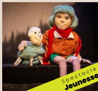
18 mai - 18 $ NORA LA TROTTEUSE