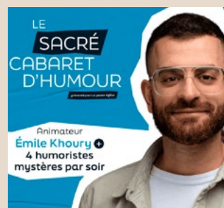
21 mai - 23 $ LE SACRÉ CABARET D'HUMOUR