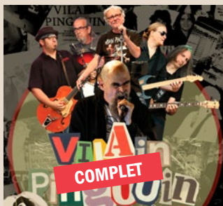
16 mai - 45 $ VILAIN PINGOUIN