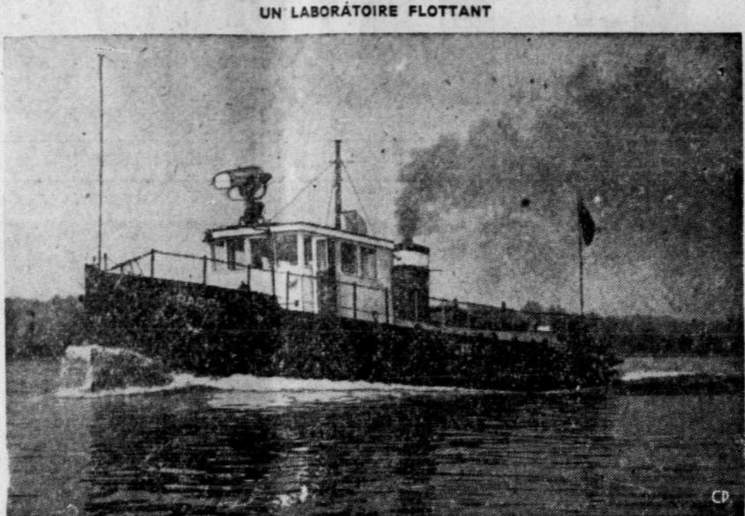
Nanti d'un nouvel équipement, le "Radel", laboratoire flottant du Conseil national des recherches, est encore parti cette année pour les Grands-Lacs. Il doit passer la plus grande partie de son été aux environs de Scarborough, Ontario, près de Toronto, où est située une station du Conseil des recherches. Ses expériences porteront surtout sur les moyens d'arriver à la "navigation aveugle", au moyen du radar.