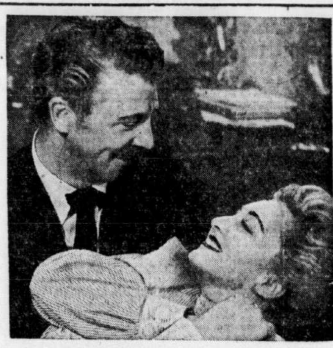
Dan Dailey et Celeste Holm tiennent les principaux rôles du film "Chicken Every Sunday" que présente cette semaine le cinéma Imperial.