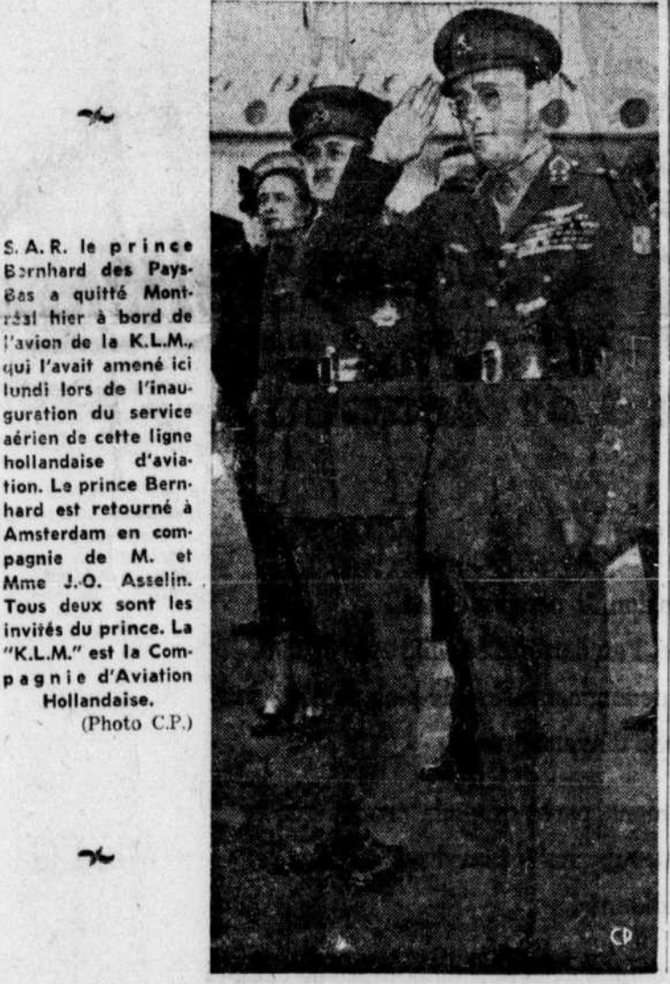
S.A.R. le prince Bernhard des Pays-Bas a quitté Montréal hier à bord de l'avion de la K.L.M., qui l'avait amené ici lundi lors de l'inauguration du service aérien de cette ligne hollandaise d'aviation.