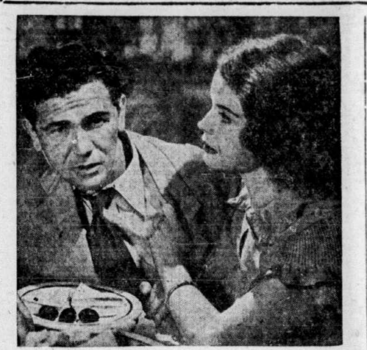
John Garfield et Beatrice Pearson tiennent les principaux rôles du film "Force Of Evil", un film sur le "milieu", que le Princess présentera à partir de vendredi prochain.