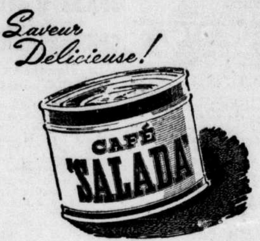
Savoir Delicieuse! CAFÉ SALADA

Pour la seconde année consécutive, l'un des principaux événements de la semaine, à Montréal, sera la remise du trophée de sécurité et d'habileté au pilotage amateur présenté par la société Colonial Airlines. Un concours est présentement tenu pour déterminer le gagnant de ce trophée pour l'année 1949.