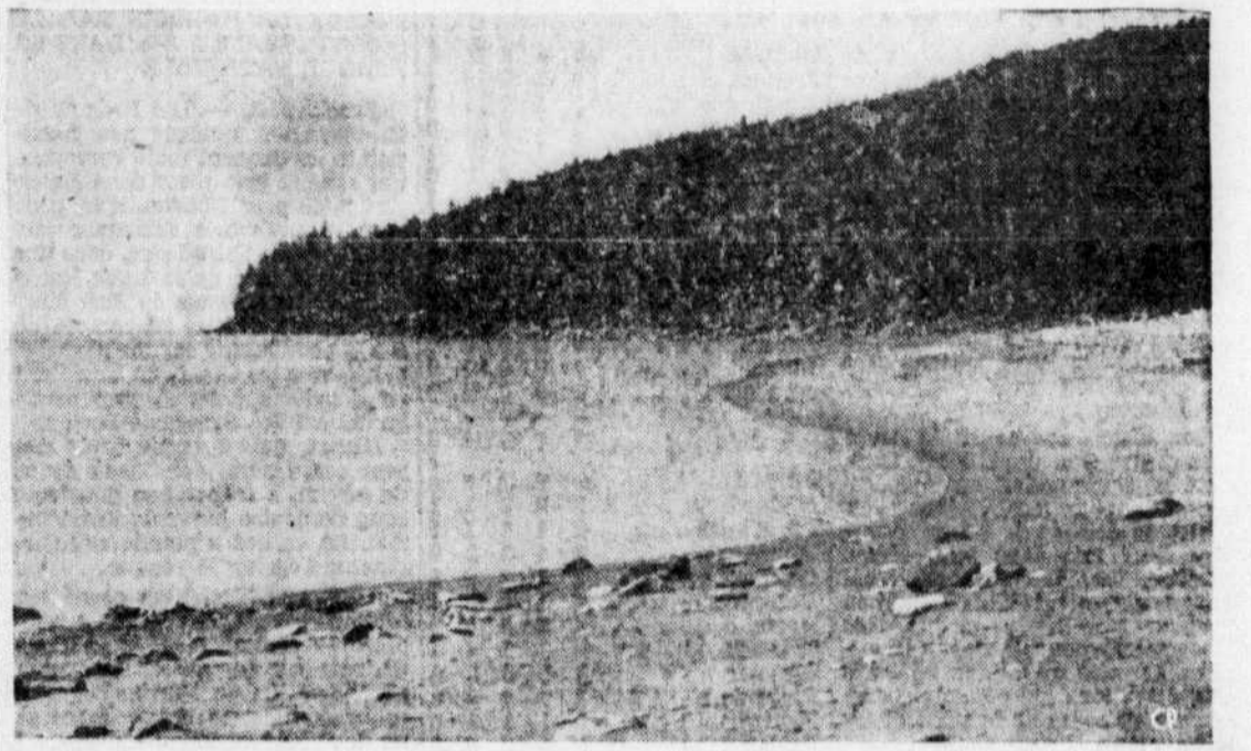
La province voisine du Nouveau-Brunswick est en train de réaliser son vieux rêve d'un parc national, dans le comté Albert, sur les bords de la Baie de Fundy. Cette photo montre le littoral du parc formant une plage. Les touristes qui en trouveraient les eaux trop froides pourraient s'ébattre dans un bassin voisin d'une longueur de 130 pieds et alimenté par la même eau de mer artificiellement réchauffée.