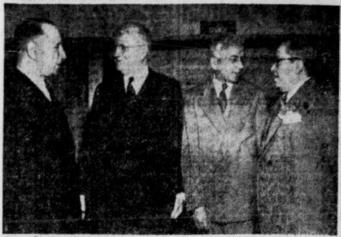
Chargée du développement et de la codification du droit international qui régit les rapports entre nations, la Commission du droit international des Nations Unies tient actuellement sa première session à Lake Success (New-York).