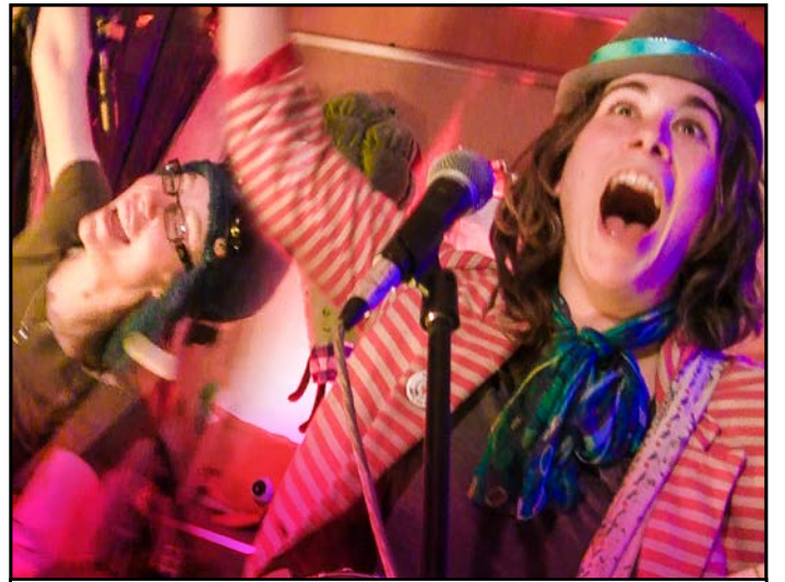
Nous voyons ici les statues de cire des 2 FOLLES ET UN BANJO au Musée du Hamburger à Cracovie. Elles ont bien sûr été déménagées au Musée du Grilled Cheese de Shanghai en 2023.