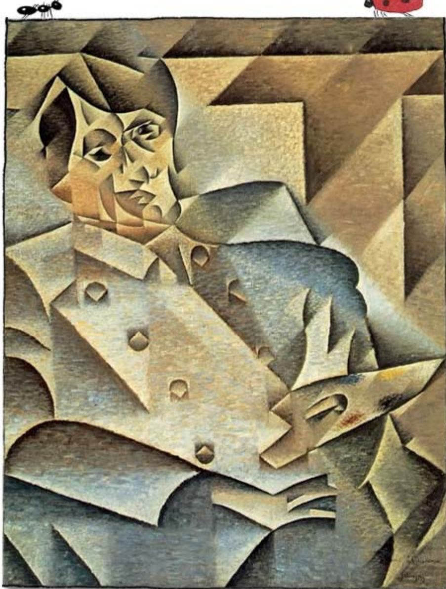
Juan Gris - Portrait de Pablo Picasso 1912, huile sur toile, 93,4 X 74,3 cm. Collection de M. et Mme Leigh Block, Art Institute of Chicago

L'importance des effets de lumière sur chaque angle de vue est aussi une des caractéristiques importantes du cubisme.