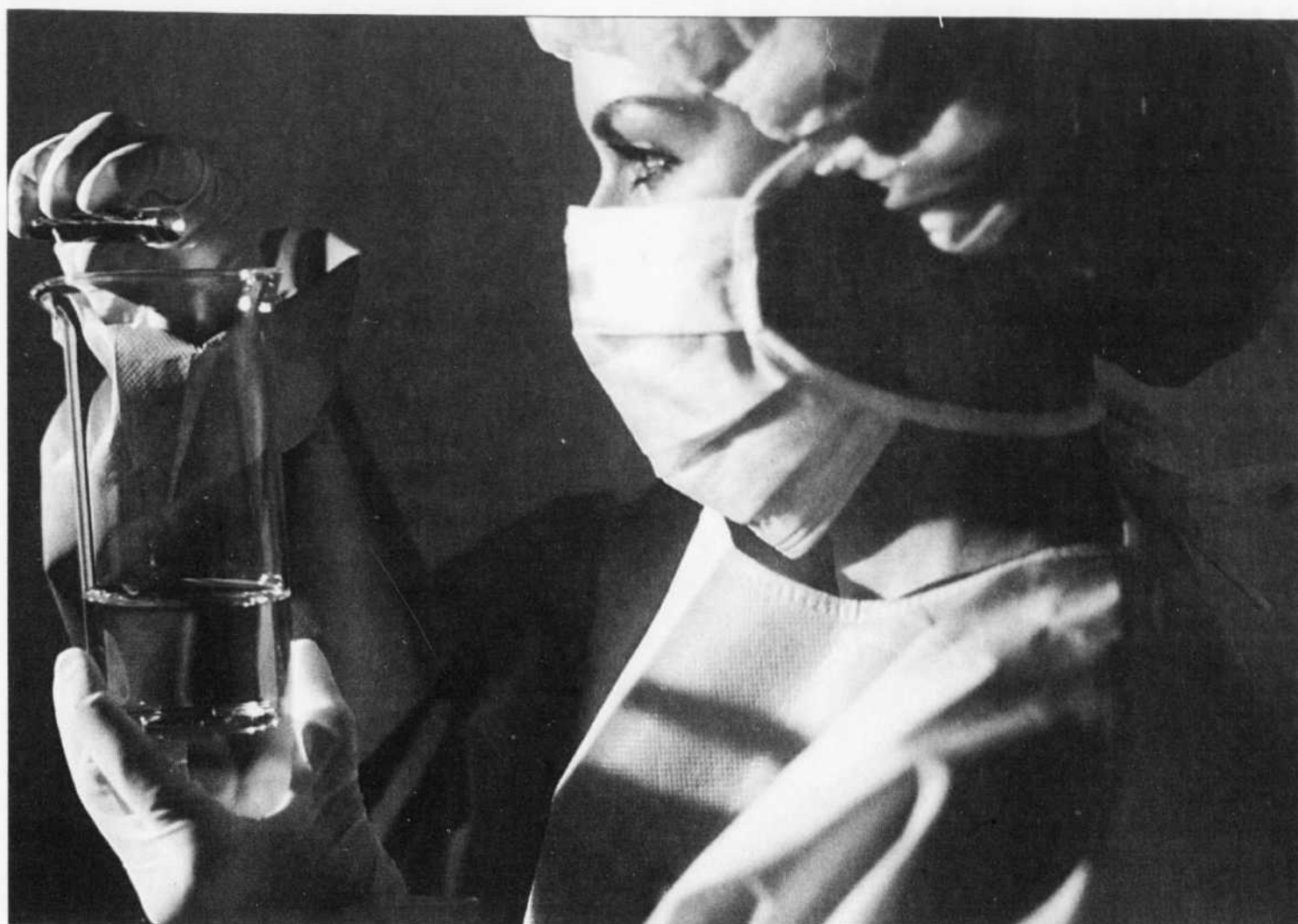
Les chercheurs prétendent que les cellules souches embryonnaires peuvent être utiles pour le traitement d'une grande diversité de maladies: Alzheimer, Parkinson, diabète, cardiopathie, etc.