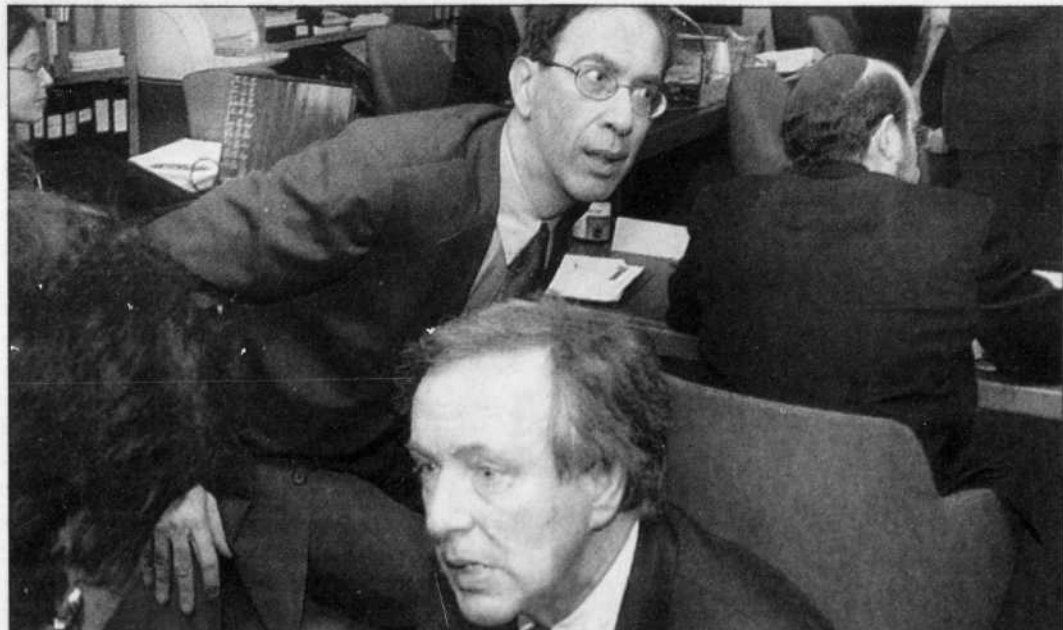
Représentés par une batterie d'avocats, les fabricants de cigarettes ont lancé hier en Cour supérieure leur croisade — prise 2 — pour faire invalider la Loi sur le tabac, qui les écartera sous peu du lucratif marché de la publicité de commandite.