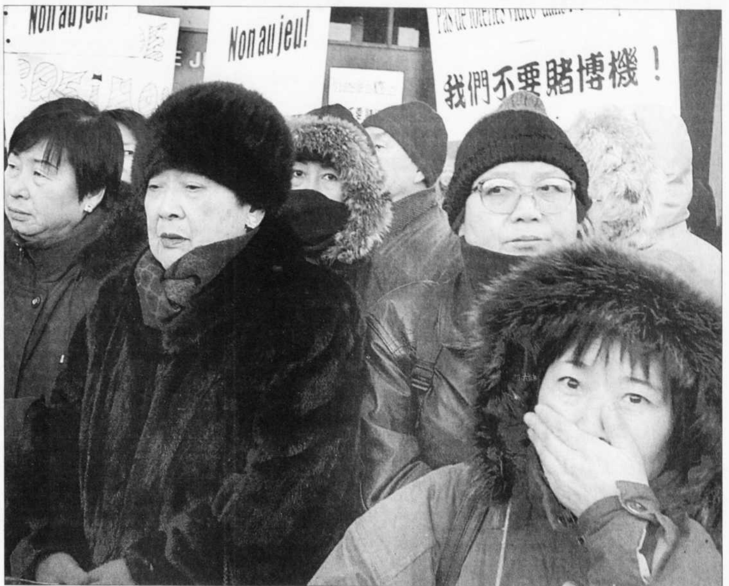
«Pas de loteries vidéo dans notre quartier!», ont fait savoir hier les opposants au projet de mini-casino dans le quartier chinois lors d'une manifestation devant les bureaux de la Régie des alcools, des courses et des jeux, rue Notre-Dame.