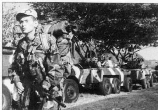
JOSE MIGUEL GOMEZ

Prêt à rencontrer à nouveau les négociateurs des Forces armées révolutionnaires de Colombie