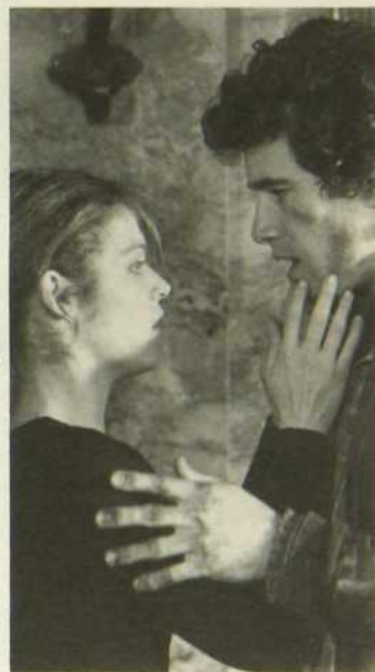
Amy Irving, Michael Ontkean