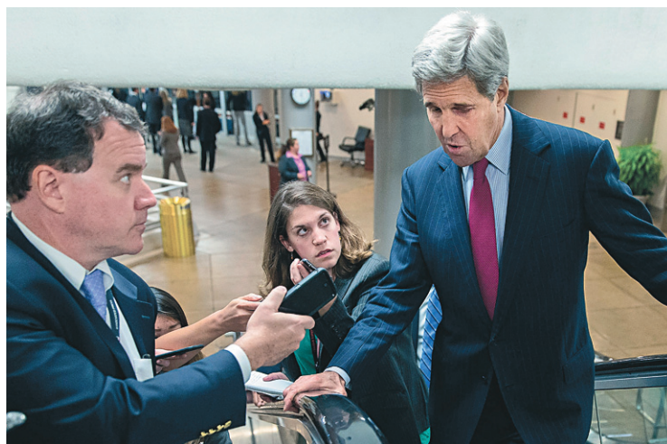
John Kerry quittant le Congrès mardi peu après sa comparution devant le Comité des Affaires étrangères

Preuve des grandes manœuvres en cours, le président américain, Barack Obama, a appelé mardi le roi Salmane d'Arabie saoudite pour évoquer en particulier la lutte contre EI et une possible transition politique en