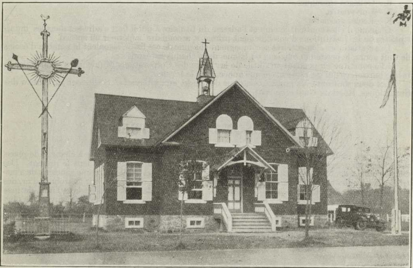
L'école du Rang No 3, municipalité scolaire de Sainte-Geneviève No 3, Haut-Saraguay, comté de Jacques-Cartier, Province de Québec. Soixante-quatre élèves fréquentent cette belle école de Rang, qui fait honneur à la commission scolaire de Sainte-Geneviève.