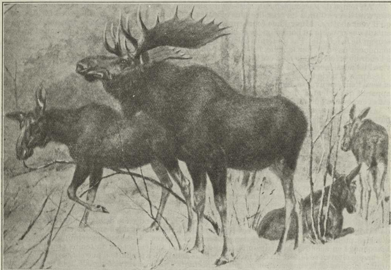
Une famille d'orignaux