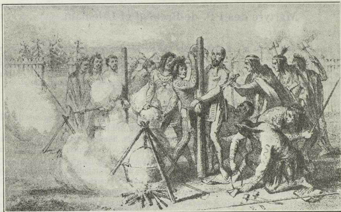
Martyre du Père de Brebeuf et du Père Gabriel Lalemant.

C'était en effet un spectacle navrant pour le vieux missionnaire de voir son jeune compagnon se tordre pour ainsi dire dans des souffrances intolérables. Au plus fort de ses tourments, le P. Gabriel levait les yeux au ciel et implorait le secours d'en haut. Ses bourreaux le couvrirent d'écorces, et, avant d'y mettre le feu, le traînèrent devant le P. de Brebeuf. Le jeune martyr se jeta à ses pieds, et se recommanda à ses prières en répétant les paroles de l'apôtre saint Paul: " Nous avons été donnés en spectacle au monde, aux anges et aux hommes ".