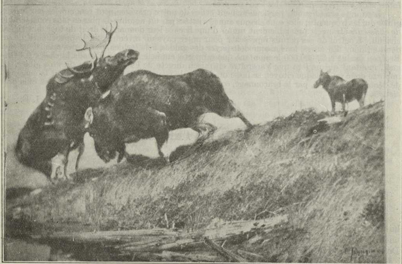
Un rude combat entre deux mâles.