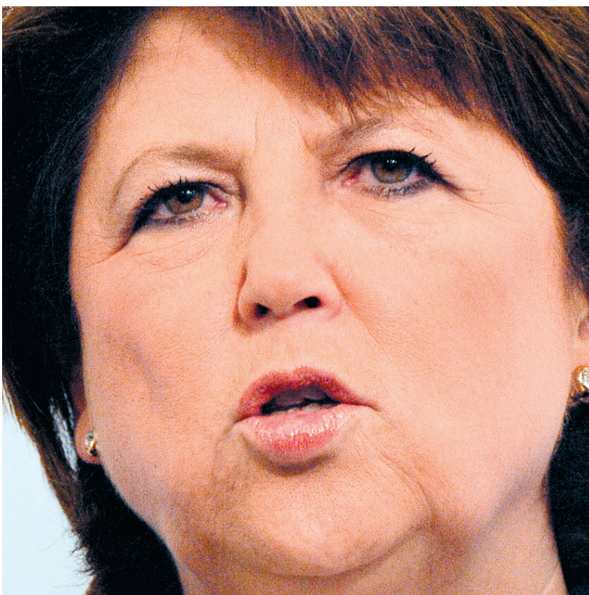
S'exprimant dimanche à l'occasion de la primaire socialiste en France, François Hollande s'est positionné comme le «candidat du changement», alors que Martine Aubry répétait que «face à la droite dure, il faut une gauche dure». Ils s'affronteront au second tour, dimanche, et rien n'est joué d'avance.