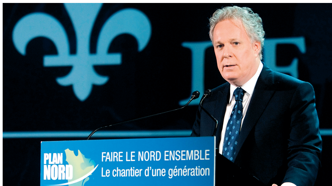
Jean Charest, lors de la présentation en mai de son projet de développement du Grand Nord

Chantal Hébert est columniste politique au Toronto Star. chebert@thestar.ca