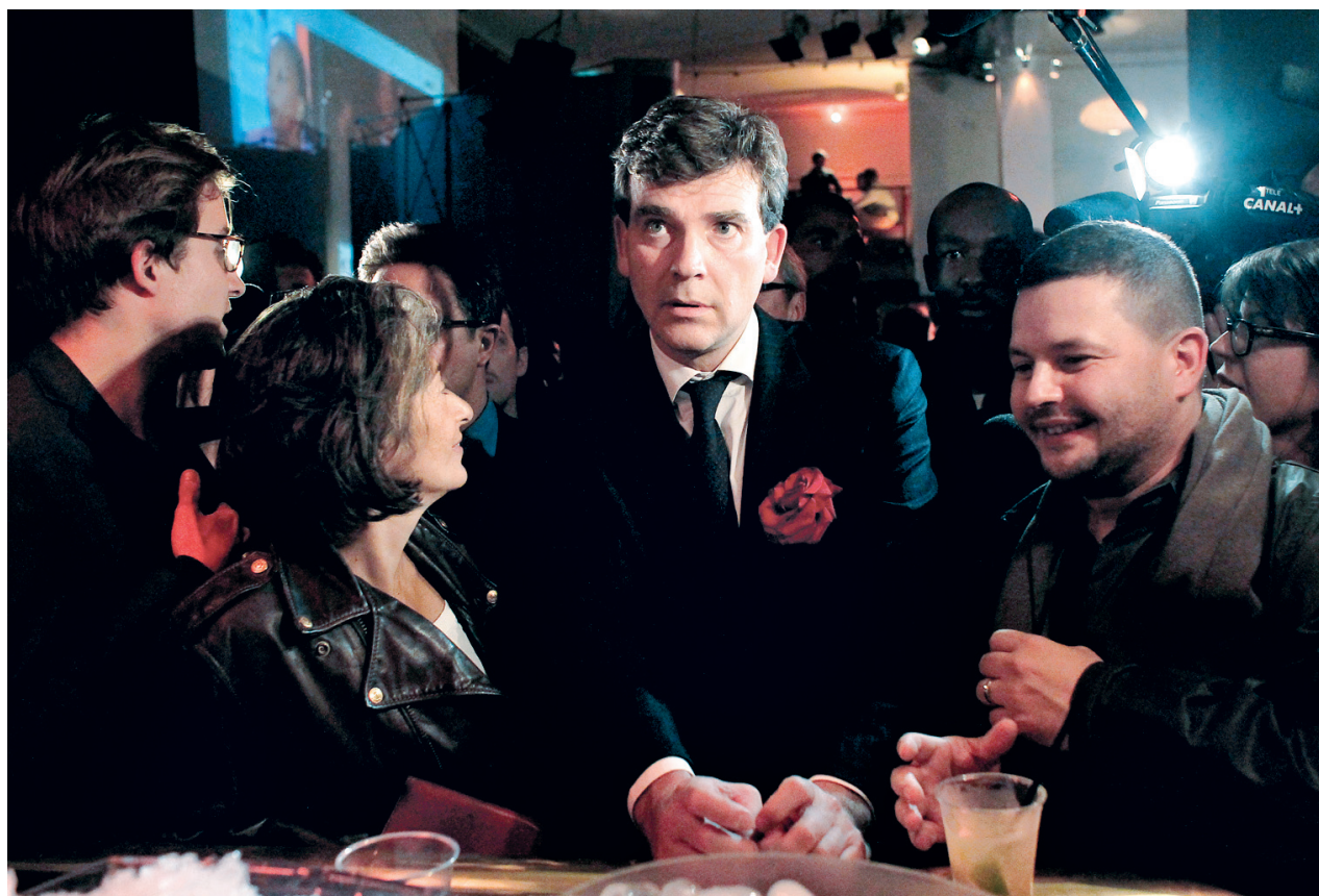
Arnaud Montebourg célèbre dimanche au bar La Bellevilloise, à Paris, son succès au premier tour de la primaire socialiste. Il a causé la surprise en récoltant 17 % des voix, et ses électeurs pourraient faire la différence au second tour.

Les manœuvres de l'entre-deux-tours sont déjà bien engagées. Dimanche, François Hollande s'est positionné comme le «candidat du changement», alors que Martine Aubry répétait que «face à la droite dure, il faut une gauche dure», Manuel Valls (6 %) a déjà annoncé son soutien à François Hollande. Quant à Ségolène Royal, elle a rencontré