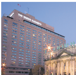
Fairmont Le Reine Elizabeth Tout Montréal à votre porte!