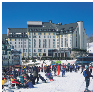
Fairmont Tremblant Le seul hotel sur les pentes de ski!