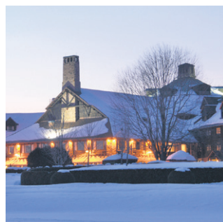
Fairmont Le Château Montebello La grande aventure canadienne vous attend!