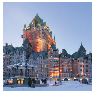
Fairmont Le Château Frontenac Site de villégiature urbain au cœur du Vieux Québec!