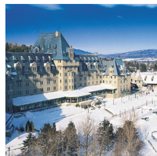
Fairmont Le Manoir Richelieu Un château sur le cap, pour mieux voir la mer!

Un monde d'avantages et de privilèges vous attend. Joignez-vous au Club du Président Fairmont! Visitez le fairmont.fr/fr/fpc