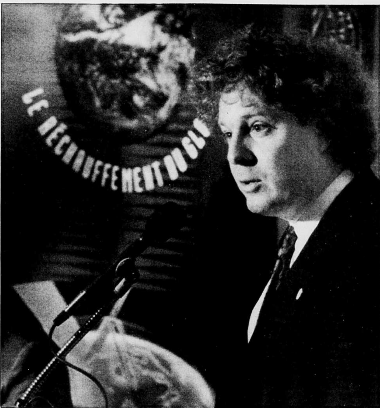
Jean Charest annonce un plan de recherche de 85 millions $.

M. Hallmand a affirmé qu'il fallait dépendre davantage des mesures de conservation de l'énergie, des programmes d'efficacité énergétique et des sources alternatives d'énergie à petite échelle, « plus douces pour l'environnement, plus économiques et moins destructrices ».