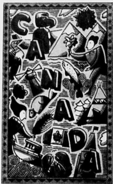
Le logo des fêtes du 125 e .

L'idée de souligner de façon particulière le 125 e anniversaire de la Confédération canadienne a pris naissance à l'automne 1989, bien avant l'échec de l'accord du lac Meech et ce qui en a découlé depuis ; bien avant aussi que la récession