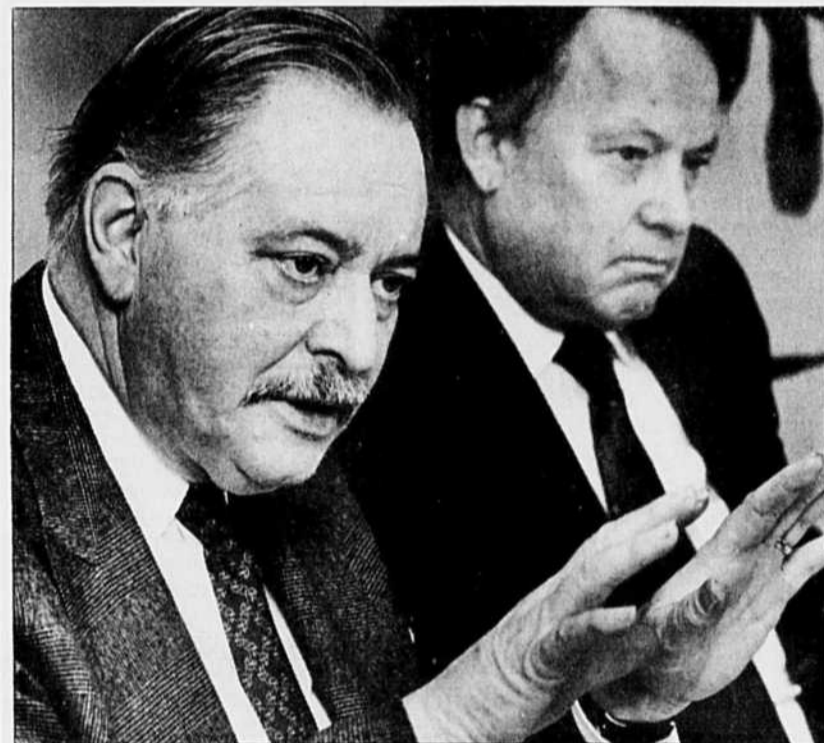
Le chef du PQ Jacques Parizeau et son vice-président Bernard Landry, hier, à Montréal, commentant les nouveaux accords du GATT.

LE PARTI QUÉBÉCOIS a accusé hier les gouvernements de Québec et surtout d'Ottawa d'avoir caché aux Québécois la menace que les nouvelles propositions du GATT font peser sur les pouvoirs économiques de la province, et a sommé les premiers ministres Bourassa et Mulrony de s'en expliquer publiquement.