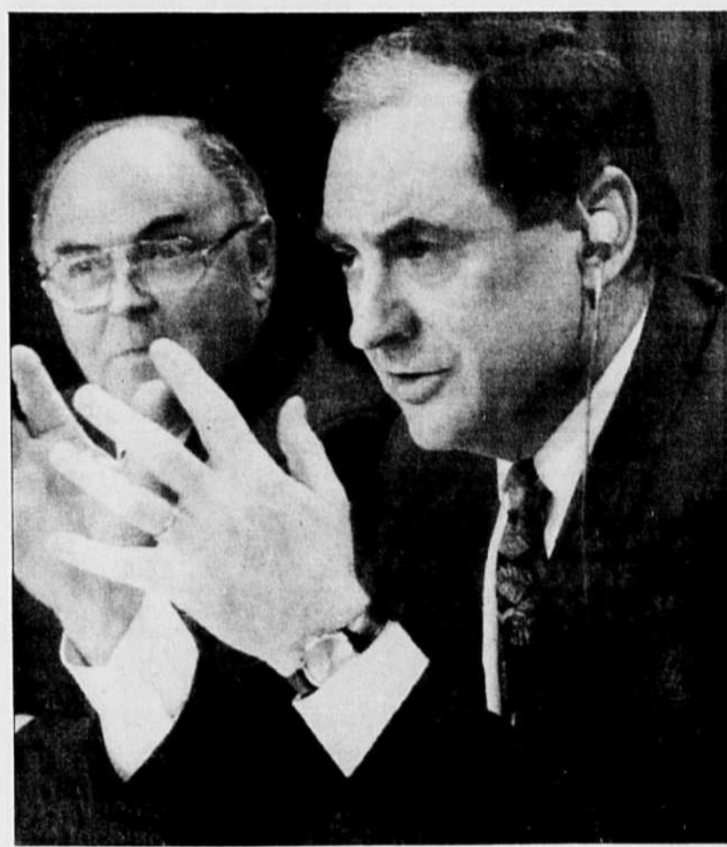
Le ministre des Finances Don Mazankowski (au premier plan) et le président du Conseil du Trésor, Gilles Loiselle, hier, à Ottawa.