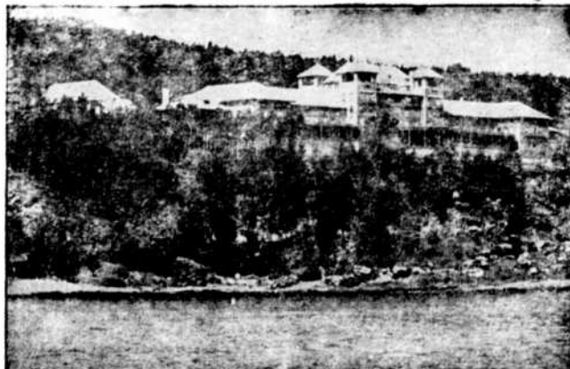
MANOIR RICHELIEU, MALBAIE