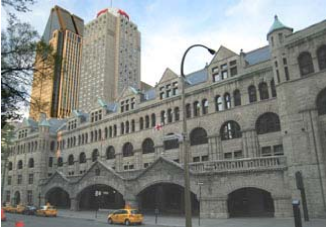
Gare Windsor à Montréal

Le Mondial de la bière 2007 se déroulera à la Gare Windsor de Montréal du 30 mai au 3 juin prochain. L'édition 2007 sera la 14e et réunira près de 133 bières et quelque 375 produits offerts en dégustation. Cet événement annuel comprend aussi divers ateliers éducatifs sur la bière, en particulier celle des micro-brasseries. La Gare Windsor est un endroit très intéressant pour ce genre d'événement car le jardin extérieur offre un cachet très agréable pour les visiteurs après leur visite des kiosques intérieurs.