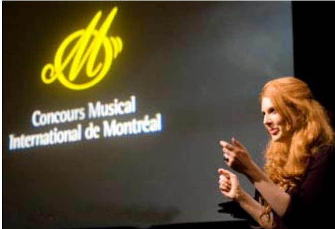
La chanteuse Mireille Lebel lors d'une conférence de presse