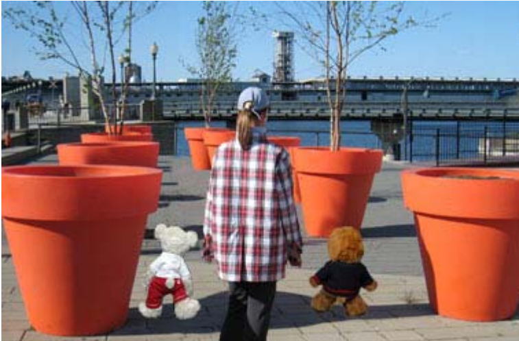
Mademoiselle X et les deux mascottes, Miss Gym et son frère Monsieur X, sur les Quais du Vieux-Port de Montréal.

«Définition de la défaite: Déconfiture et pas de pot...»