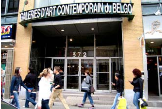
Edifice Belgo - Rue Ste-Catherine à Montréal

Le photographe Pierre Maraval a officiellement inauguré son exposition de photos: " Mille Femmes Montréal ".