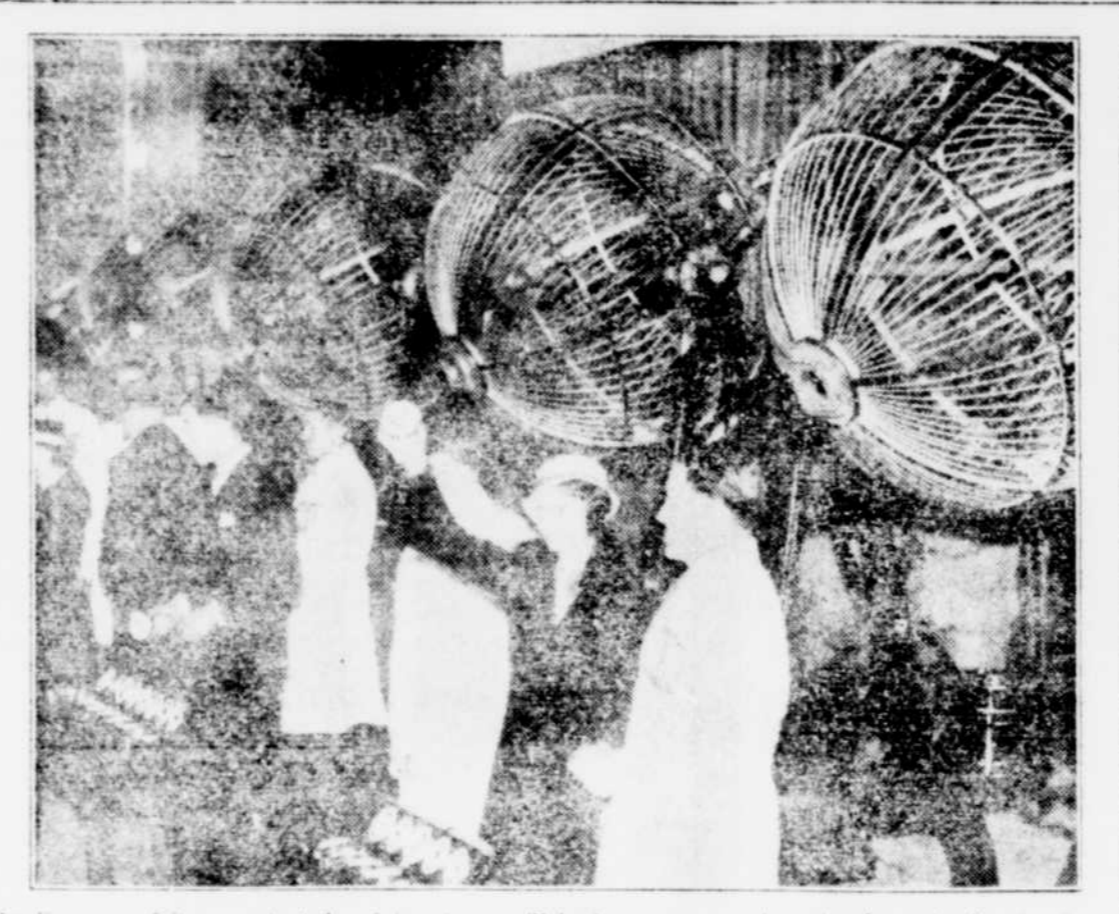
La France ne fait pas autant de cérémonies que l'Irlande pour sa interie nationale, mais elle n'en fait pas les choses moins correctement. On voit les organisateurs français faisant un répétition générale du tirage de la première émission de la interie nationale, au Trocadéro, à Paris.