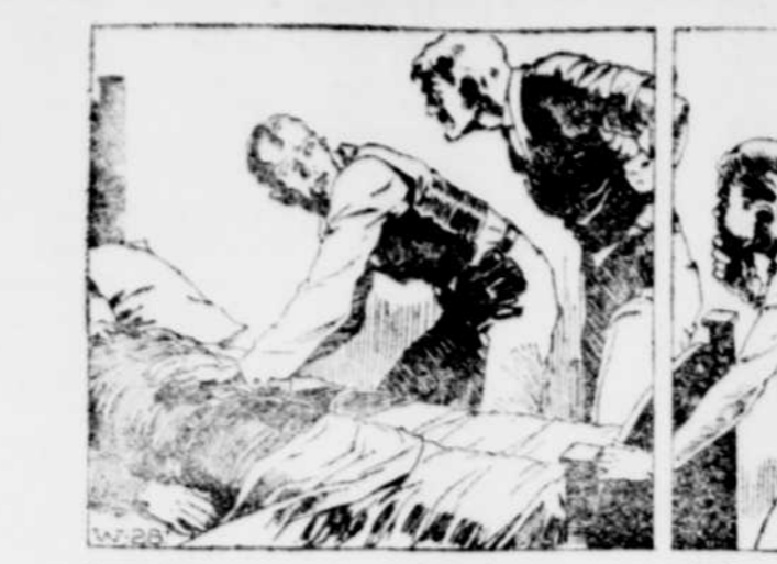
J'examinai encore la figure crispée du mort et ses doigts décharnés, puis, reprenant un frisson, par votre scène était lugubre, je me tournai vers Smith qui attendait mes conclusions en me regardant de ses yeux froids et luisants.