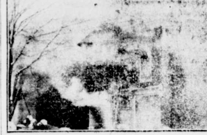
On voit ci-dessus l'immeuble J.-O. Bourbeau, à Victoriaville qui a été la proie des flammes.