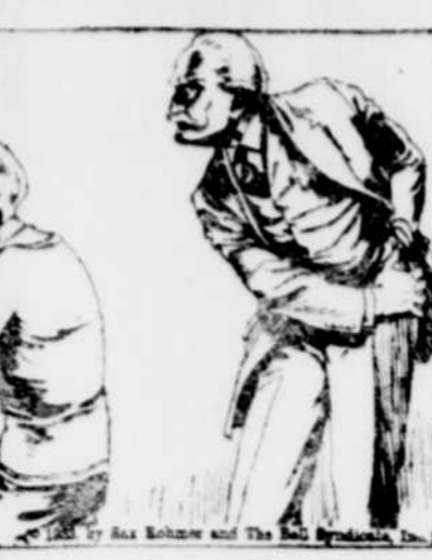
Smith sortit de sa poche un couteau multi-usage petit couteau dont un crochet. "As-tu un crochet de sangle Petrie", me demanda-t-il, "ou quelque chose semblable?"