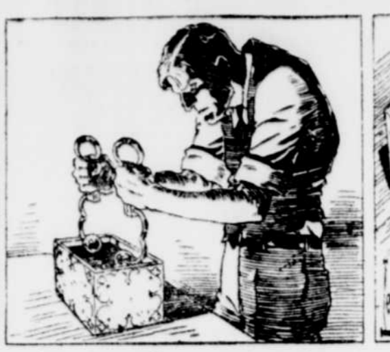
L'inspecteur sortit une paire de menottes et silencieusement, nous nous rendîmes au circuit. Smith ouvrit les menottes à leur plus grande ouverture, inséra les pointes dans le trou du coffret trois longues barres de plomb, et leva le deuxième couvercle.