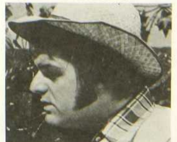
Maigrichon et Gras-Double