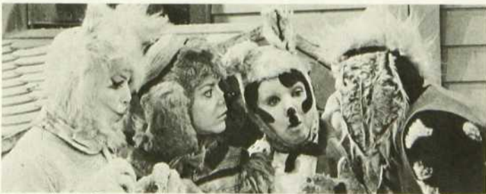
Maigrichon et Gras-Double