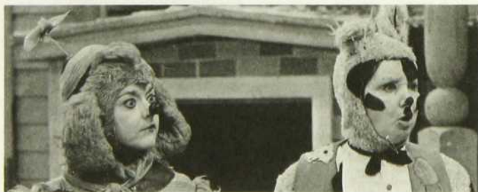
Nic et Pic