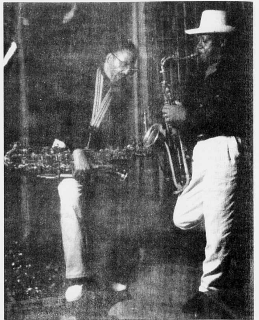
Rarement un album n'aura été aussi bien conçu. La confection de ce Soul Mates est exemplaire. Sur cette photo tirée du livret, Sahib Shihab et Charlie Rouse