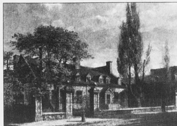
«Château de Ramezay»

(Mentionner qu'il s'agit d'une contribution versée aux victimes de la famine en Afrique. Un reçu d'impôt vous sera envoyé sur demande.)