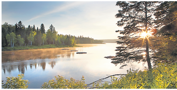
Le lac Touladi