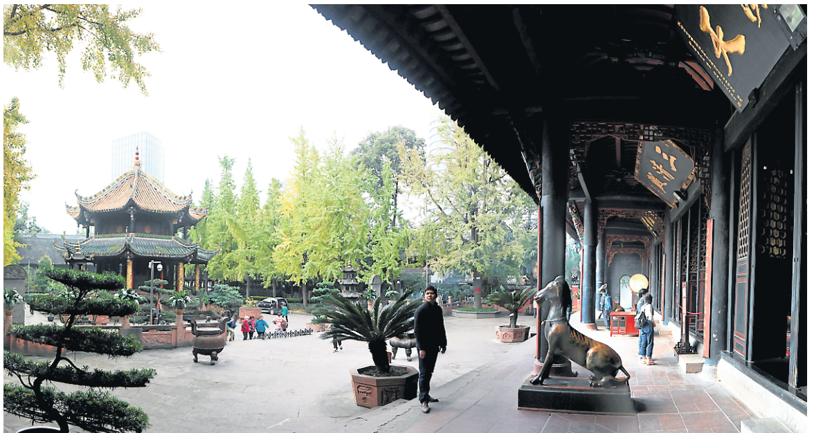
Une des fameuses chèvres de bronze du complexe historique Qingyang Gong consacré au taoïsme symbolisant une apparition de Lao Tseu, fondateur de la philosophie Tao.