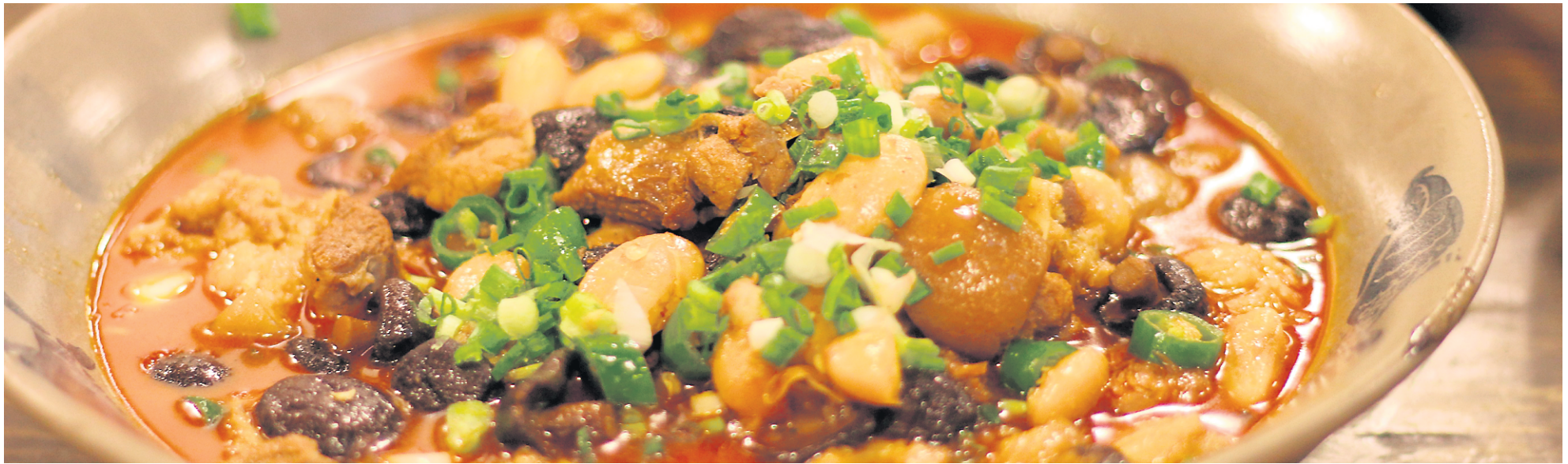
Foie de boeuf dans un restaurant de Chengdu