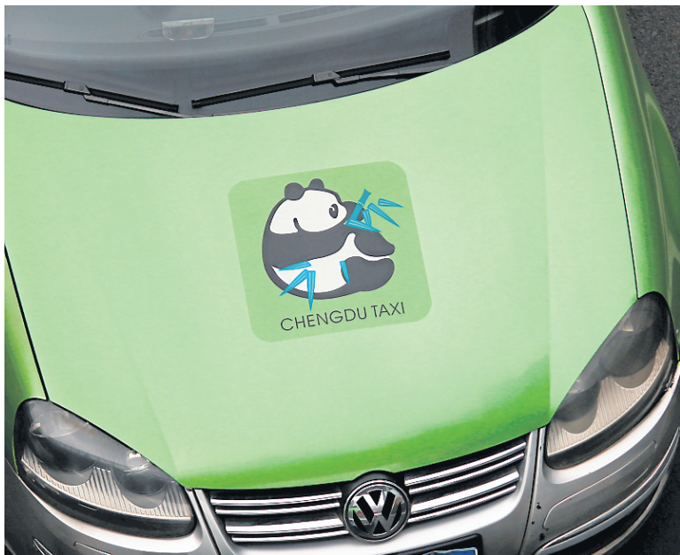
La grande majorité des taxis de la ville de Chengdu arborent une image de panda sur leur capot.