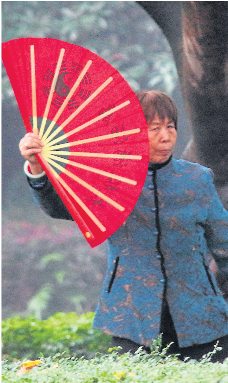
Dans un parc de Chengdu

lit de patates? «Même pour moi, cela paraît un peu étrange...», confie mon amie Fei. Ouf, pas si fou!