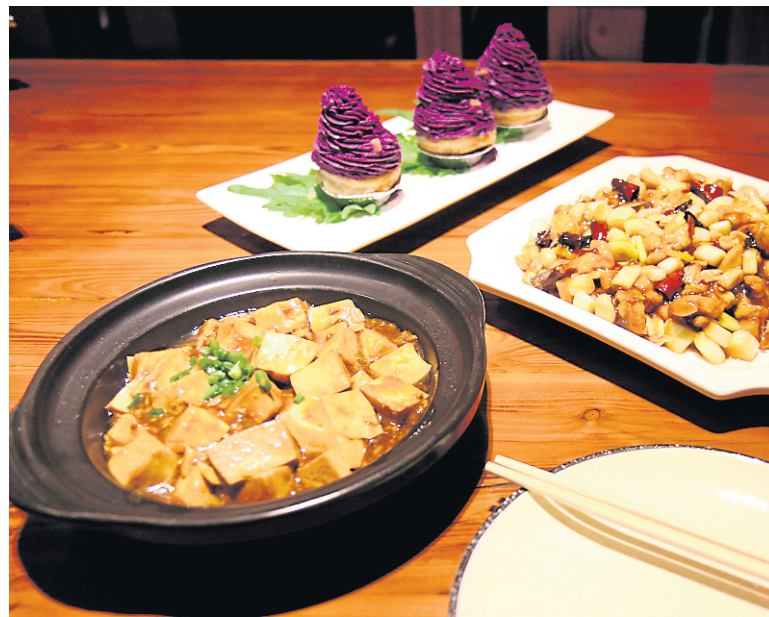
Plats dans un restaurant de Chengdu