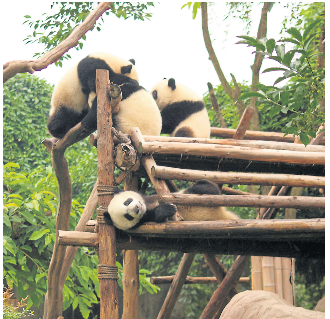
Au gré de sentiers asphaltés longeant les vastes enclos, les visiteurs peuvent scruter, avec éblouissement, des pandas de tous âges, du préadolescent à l'adulte pataud.

Mieux vaut arriver tôt le matin pour voir les pandas éveillés.