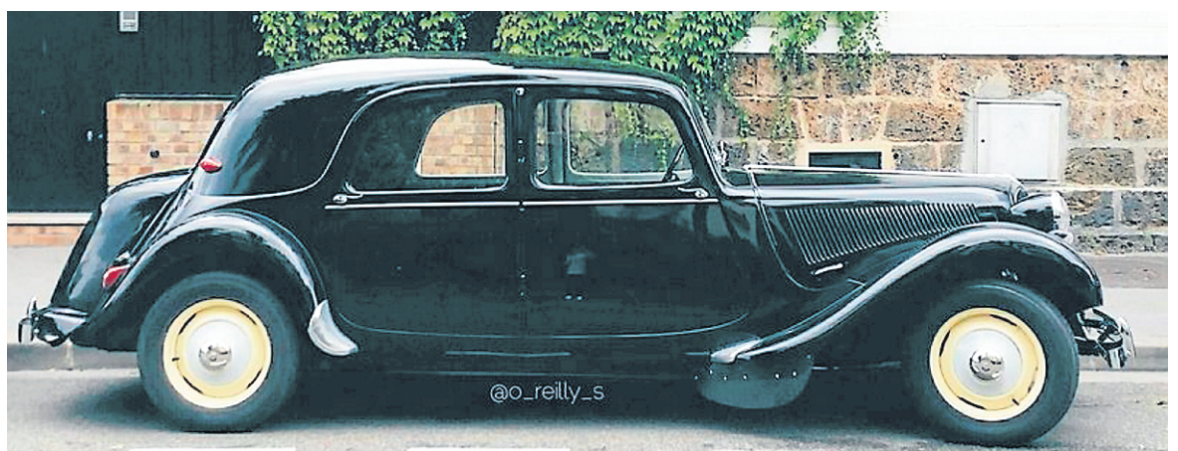
Les voitures dites vintage sont mises en évidence dans le compte Instagram de la Parisienne d'adoption.