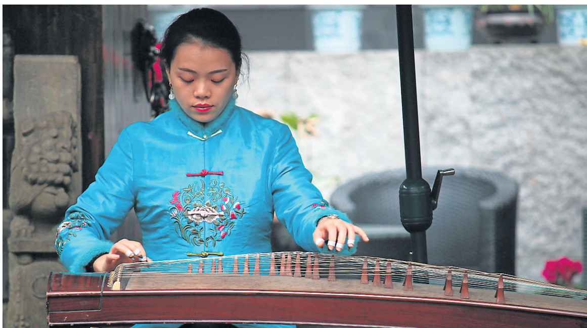
Plusieurs musiciens font la démonstration de leur talent dans la rue Jinli.