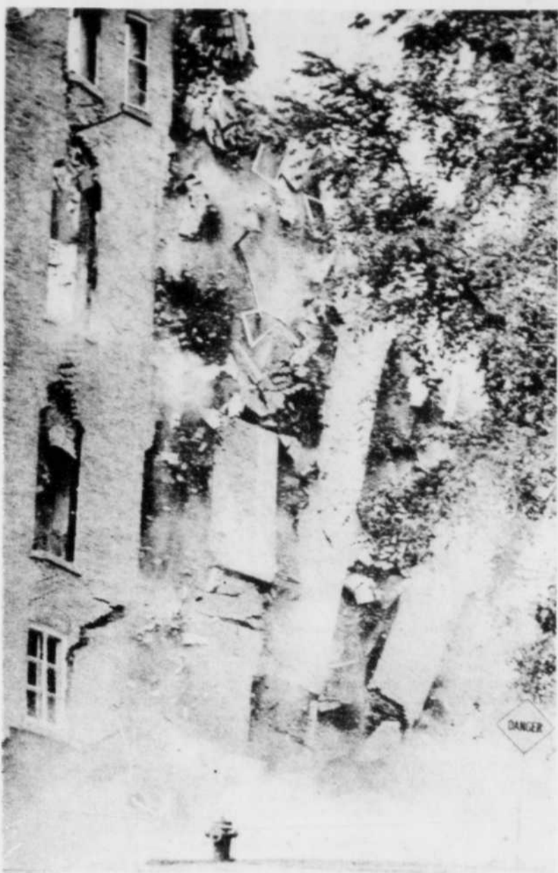
Un pan de mur du collège Jésus-Marie s'écroule comme un château de cartes sous la poussée d'une puissante charge d'explosifs.

SILLERY (PC) — Le début des travaux de démolition des ruines du collège Jésus-Marie, à Sillery, a causé un certain émoi hier.