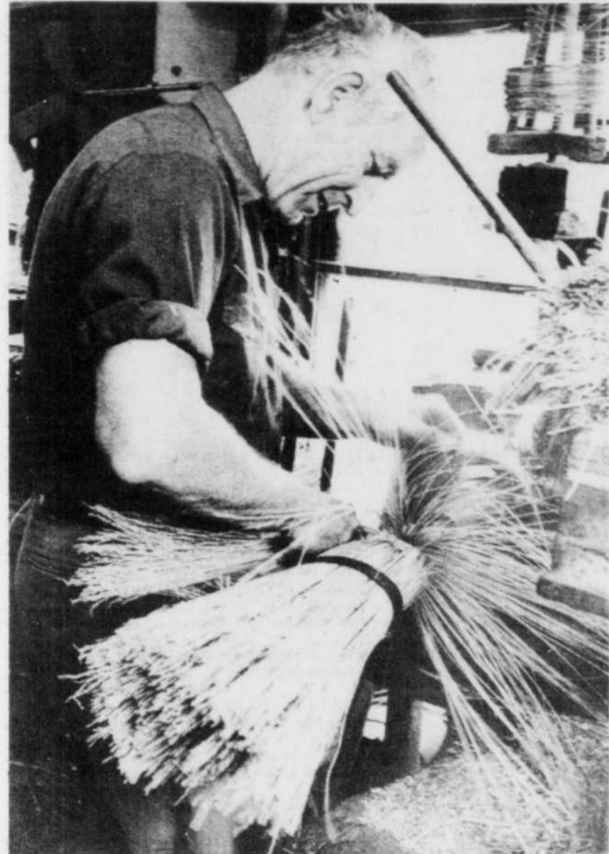
Balais à l'ancienne

Par ailleurs, les besoins financiers au budget des provinces atteindront un total de 10 milliards $, soit quelque 5 p.c. de moins que l'an dernier.