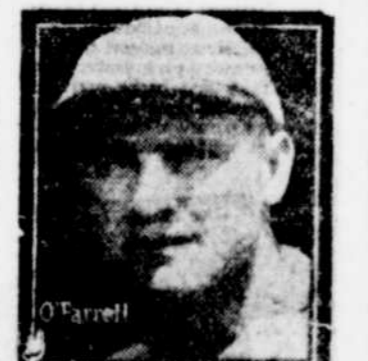
Bob O'FARRELL, qui a remplacé Hornsby à la gerance du St-Louis.