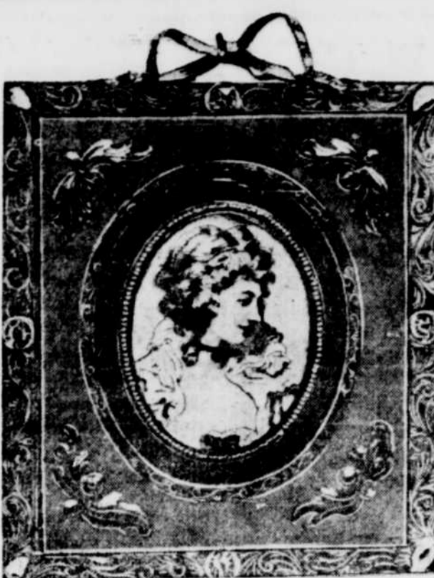
Voici la reproduction inédite d'une miniature de Catherine LOWTHER, la fiancée du général Wolfe.

L'heureux couple est parti en voyage de noces à Québec et Daveluyville. Nos meilleurs vœux de bonheur.