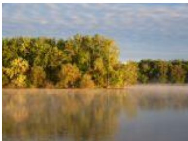
© Sauvons nos 3 grandes îles de la rivière des Mille-Îles

Nature Québec a accueilli avec enthousiasme la mise en réserve des îles Saint-Joseph, aux Vaches et Saint-Pierre. Ce geste du gouvernement est important considérant la valeur écologique de ces trois îles et leur localisation, au cœur de la région métropolitaine de Montréal, là où la pression sur les écosystèmes est l'une des plus fortes.