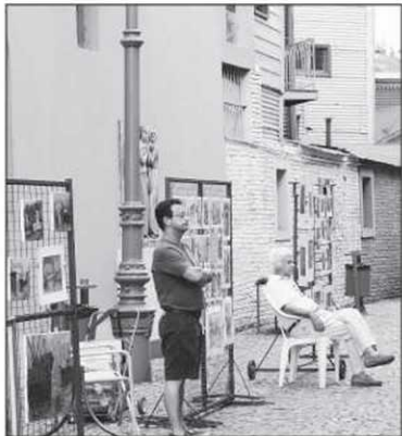
La Boca, premier quartier portuaire de Buenos Aires

design original, de restaurants à la mode. Et d'un superbe musée au moins, le MALBA, à la collection spécialisée en art latino-américain (gratuit le mercredi).