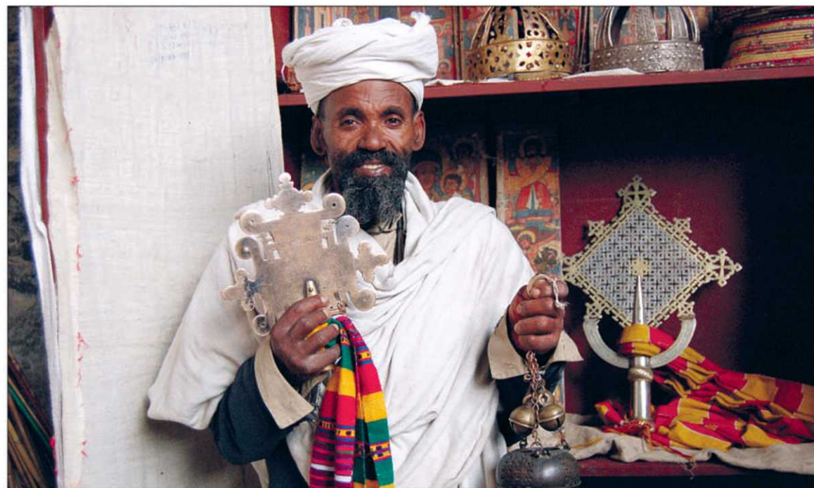
Le prêtre de l'église de Nakuto Lab, du nom du neveu de Lalibela qui l'a fait construire dans une caverne de la falaise, présente les croix en argent et autres trésors d'époque (XIII e siècle).

La piste vers Lalibela grimpe sur les hauts plateaux. À mi-pente, ruisselle une eau sacrée. Tous les conducteurs s'arrêtent pour s'asperger d'eau bénite, déposer leur obole dans le petit autel et s'assurer ainsi d'un bon voyage.