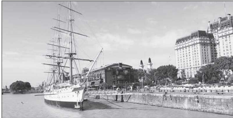
Puerto Madero, un quartier portuaire devenu chic. À droite, la Casa Rosada, le siège du gouvernement argentin