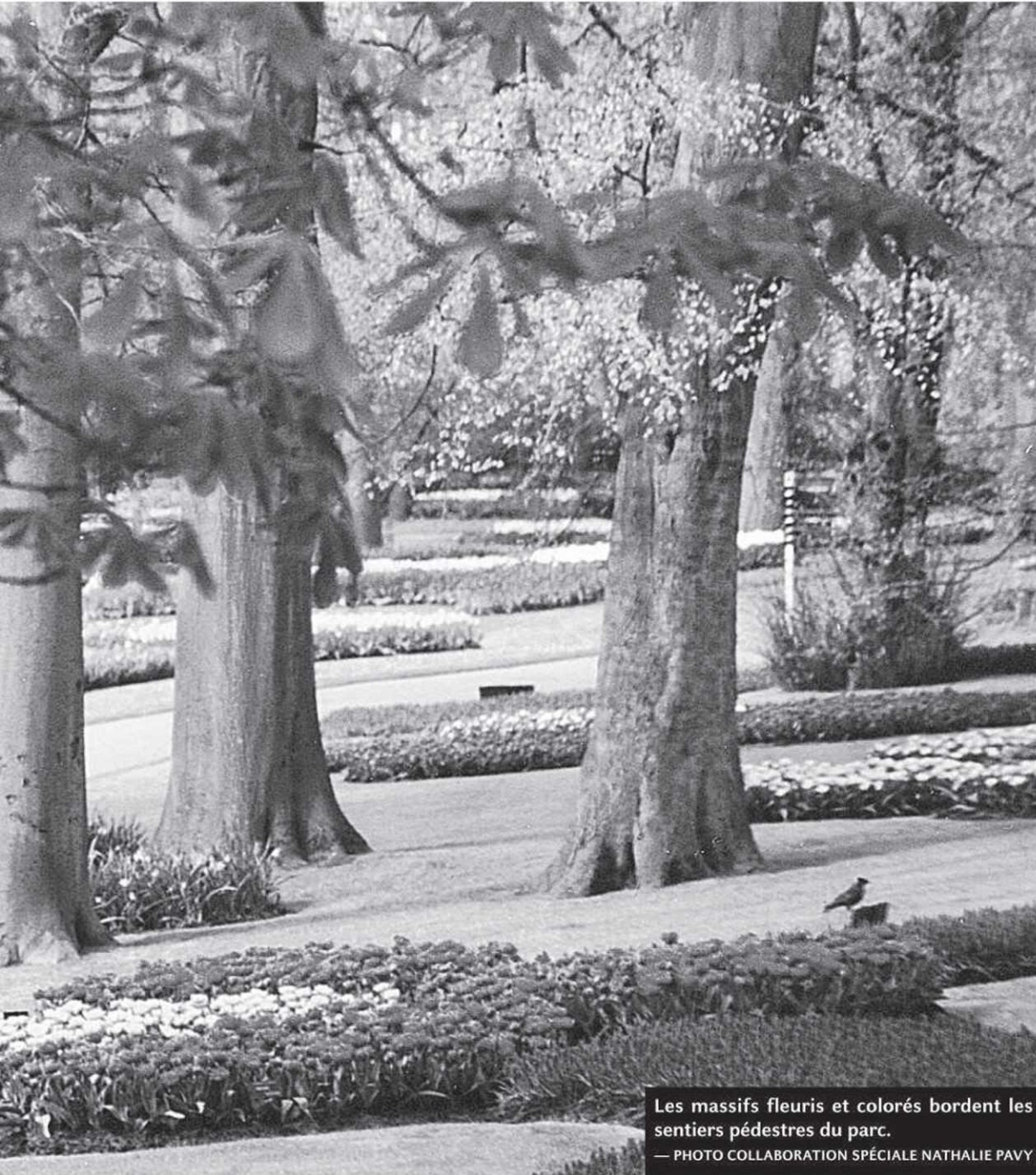
Les massifs fleuris et colorés bordent les sentiers pédestres du parc.

leurs et sont renouvelées chaque année. Le parc est un musée à ciel ouvert. Aussi, de charmants jardins faciles à réaliser sont imaginés pour inspirer le visiteur qui