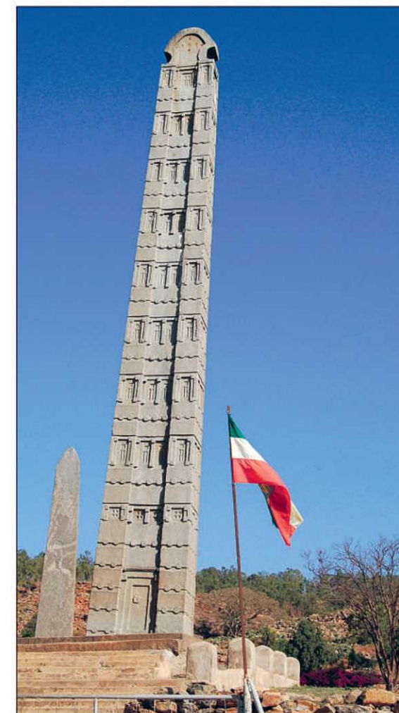
La grande stelè d'Ezana, à Axoum

ment du Derg (dictature militaire conduite par Mengistu).