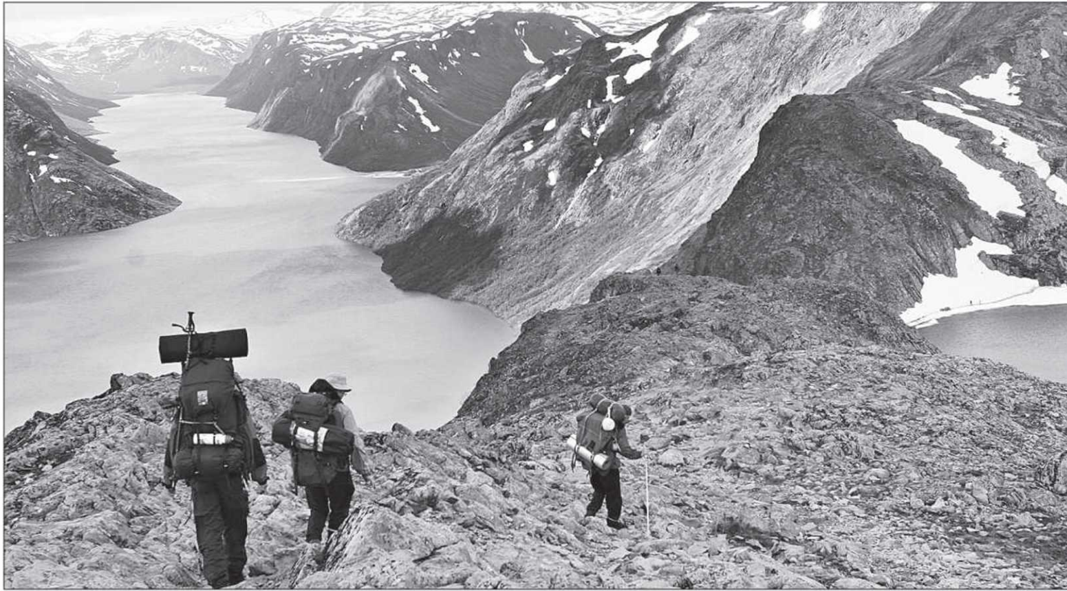
Avant de vous lancer dans la rédaction, pensez à vos lecteurs. Voudront-ils lire indéfiniment la description de vos repas? Votre contenu se doit d'être intéressant!