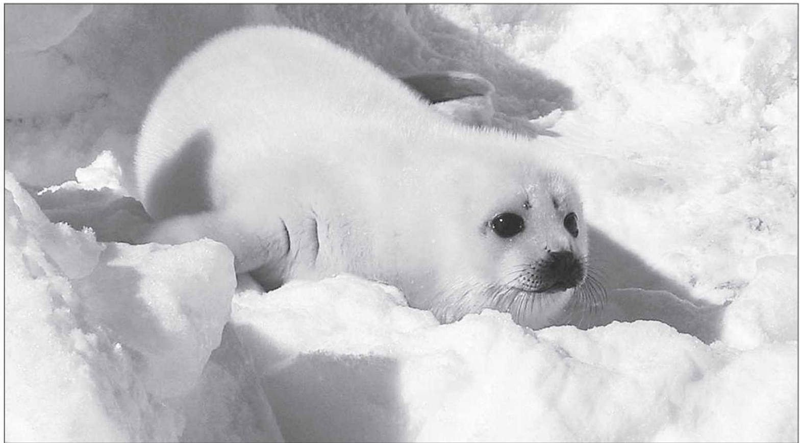
Du 28 février au 14 mars aux Îles-de-la-Madeleine, on peut vivre une expérience unique au monde : on monte à bord d'un hélicoptère qui nous emmène sur la banquise pour observer les blanchons.

→ Chaque année en mars, à l'Isle-aux-Grues, on célèbre la mi-carême, une fête d'origine française, qui jadis servait de pause au milieu du carême. À l'arrêt du traversier en décembre, les femmes de l'île se rassemblent en secret dans les maisons pour confectionner de magnifiques costumes qui ne seront montrés qu'au moment de la fête. Durant la semaine, les mi-carêmes frappent aux portes des maisons, entrent à la file indienne, changent leur voix, leurs gestes et leurs mimiques... Car réussir sa mi-carême consiste à ne pas se faire reconnaître... Pas évident dans un endroit où tout le monde est tricoté serré. Le samedi soir, tous les mi-carêmes se rassemblent à l'école de l'île. Du 9 au 14 mars. 418 241-5117 Pour y aller : Air Montmagny : 418 248-3545 www.isle-aux-grues.com