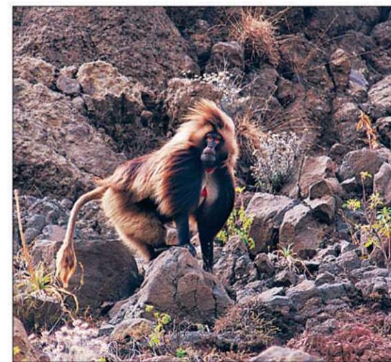
Les babouins gelada ne sont pas rares dans les falaises.

Cette région, frontalière avec l'Érythrée, garde les traces des guerres successives et notam-