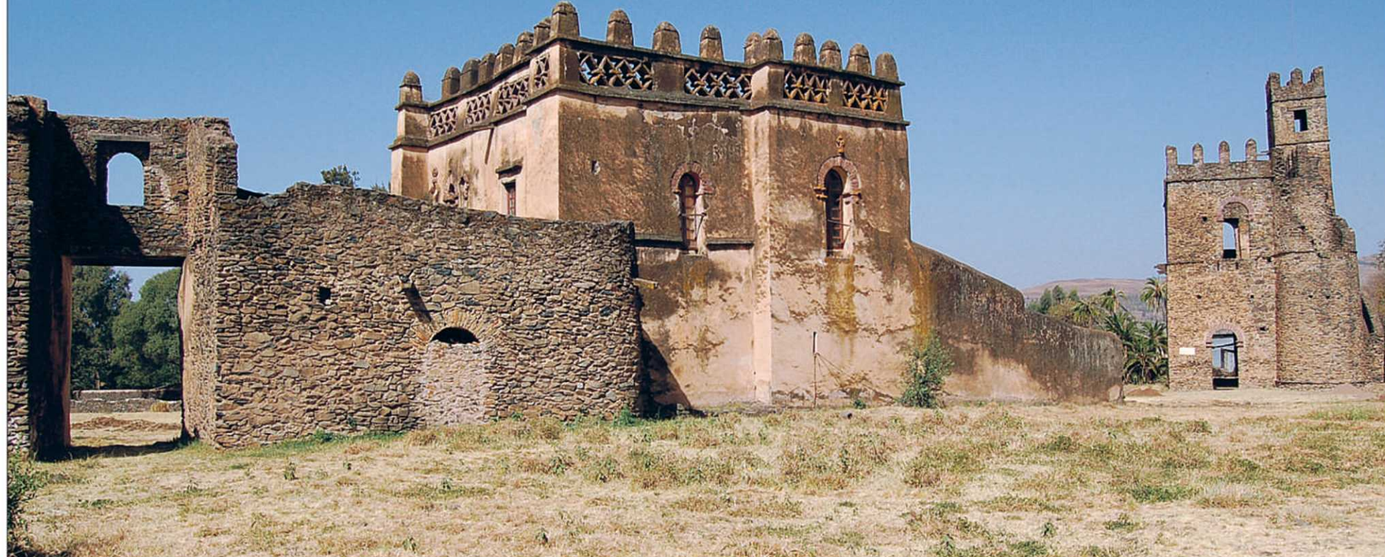
Bâtiments de la cité impériale de Gondar avec, de gauche à droite, la bibliothèque et la chancellerie qui datent du règne de Yohannès I er (1667-1682).