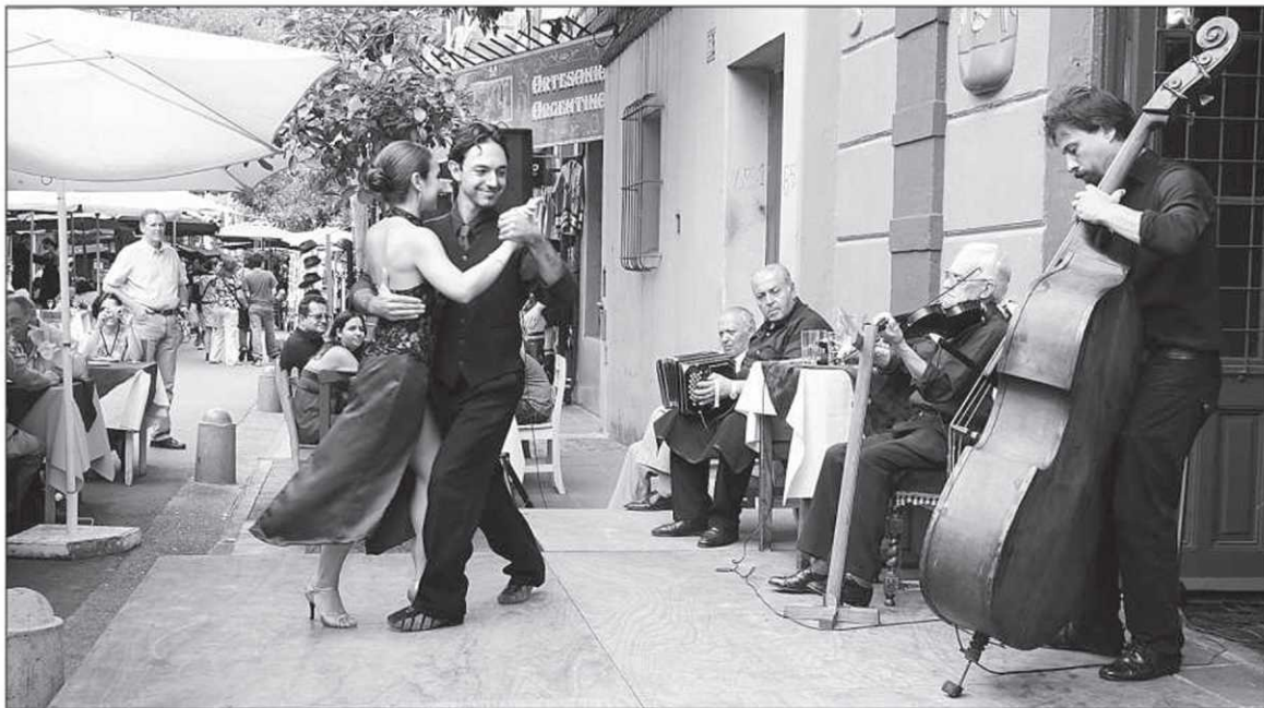
Le fameux tango, dans la rue comme sur les terrasses des restaurants.