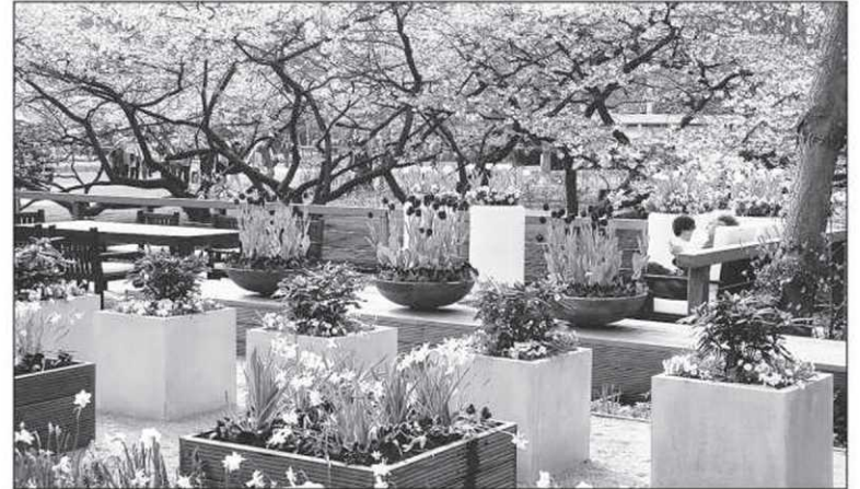
En saison, plus de 600 employés s'affairent dans les jardins, accueillent les visiteurs et répondent à leurs questions.

connaisseurs de plantes à l'affût de nouveautés, les amateurs d'art et de photographie, les touristes internationaux et les promeneurs du dimanche.