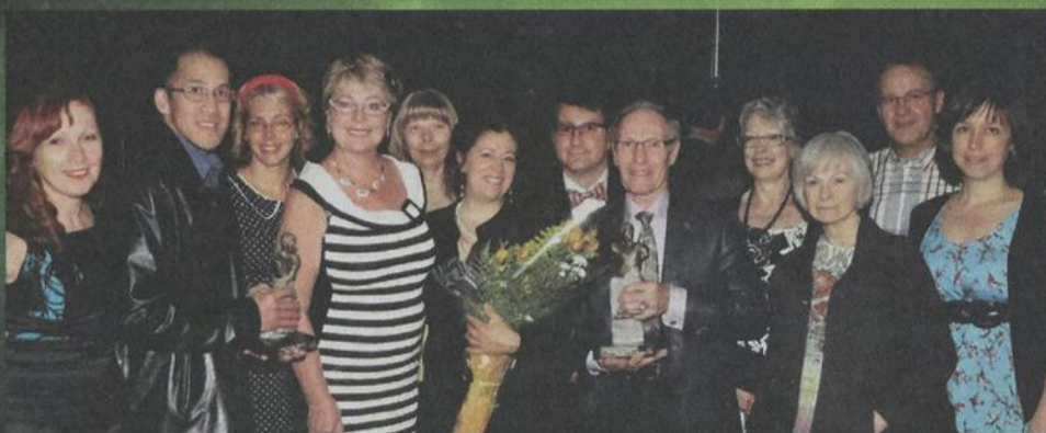
Hommage 25 e anniversaire du Festival de peinture à Mascouche