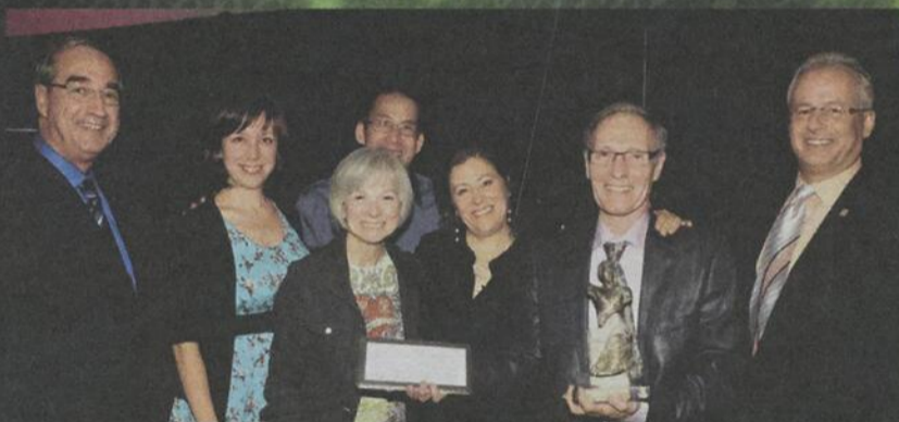
Festival de peinture à Mascouche Coup de Main Mondor Organisme