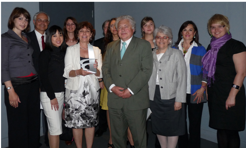
Remise des Prix Excellence 2009 de la SQPRP, le 28 mai 2009.

En mai 2009, la SQPRP a décerné un prix Excellence à l'AETMIS pour souligner la qualité exceptionnelle de la campagne de relations publiques et de l'organisation de l'événement HTAi 2008, congrès annuel de Health Technology Assessment International . Tenu à Montréal du 4 au 8 juillet 2008, ce congrès scientifique international avait accueilli plus de 850 participants des cinq continents. Cet événement s'est avéré un formidable moteur de promotion de l'ETS au Québec et dans le monde, notamment en Amérique du Nord et dans les pays émergents. Le dossier de HTAi 2008 présenté à la SQPRP sera également publié comme étude de cas dans un manuel sur les relations publiques qui paraîtra aux Presses de l'Université du Québec, à l'été 2010.