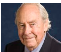
D r Réginald Nadeau , cardiologue, chercheur, Centre de recherche de l'Hôpital du Sacré-Cœur de Montréal, et professeur émérite, Faculté de médecine, Université de Montréal